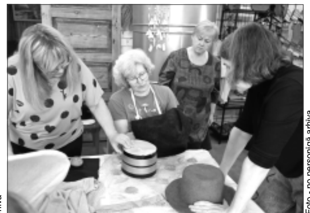
Piedalās meistardarbnīcās. Vilnas platmales izgatavošana prasīja lielu rūpību un zināšanas.

Istenotie pasākumi nostiprināja un veicināja iedzīvotāju izpratni par kopienu veidošanos un līdzdalību. Aktivitāšu dalībniekus iedrošināja attīstīt kopienu sadarbības iniciatīvas, lai paaugstinātu NVO un iedzīvotāju savstarpējo sadarbību, veicinātu dažādu sabiedrības grupu savstarpējo uzticēšanos.