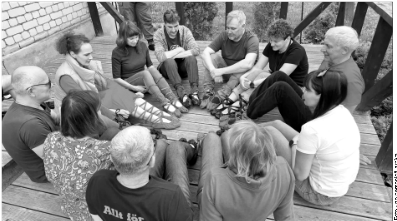
Gatavo pastalas. Tās noderēs raitam dejas solim.

Istenojot projektu, veikta arī biedrības tīmekļa vietnes optimizācija un satura pieejamības paaugstināšana. Biedrībai uzlabojās informācijas pieejamība digitālajā vidē, kas informē sabiedrību