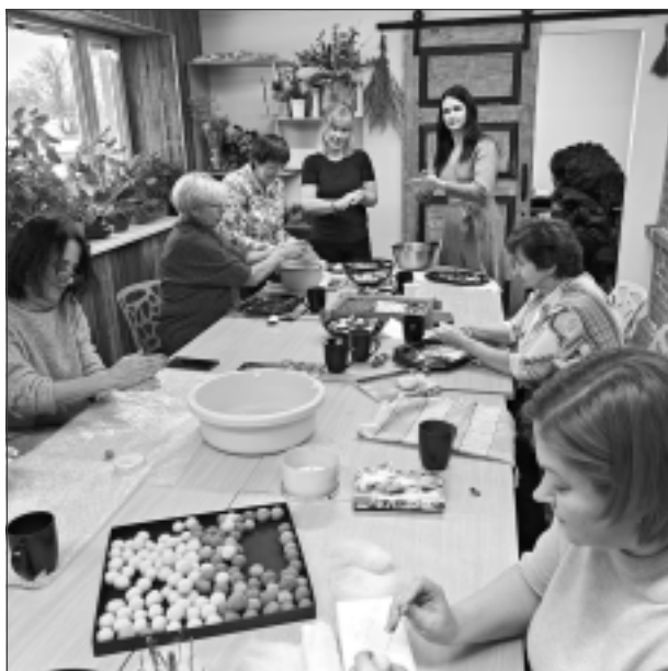
Labā ideja. Ziemeļlatgales tautu tērpa vainaga fragmenta ar ziedu ornamentu izgatavošanas meistardarbnīca apmeklētājos radīja lielu interesi.