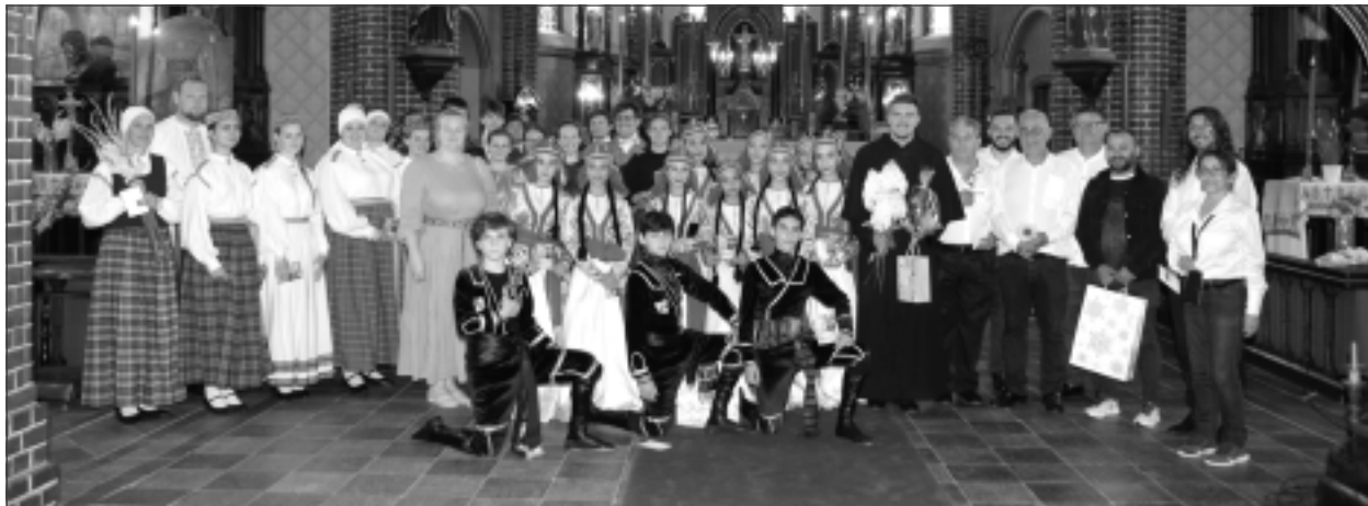
Pēc koncerta baznīcā. Latvija, Čehija, Gruzija, Kostarika...