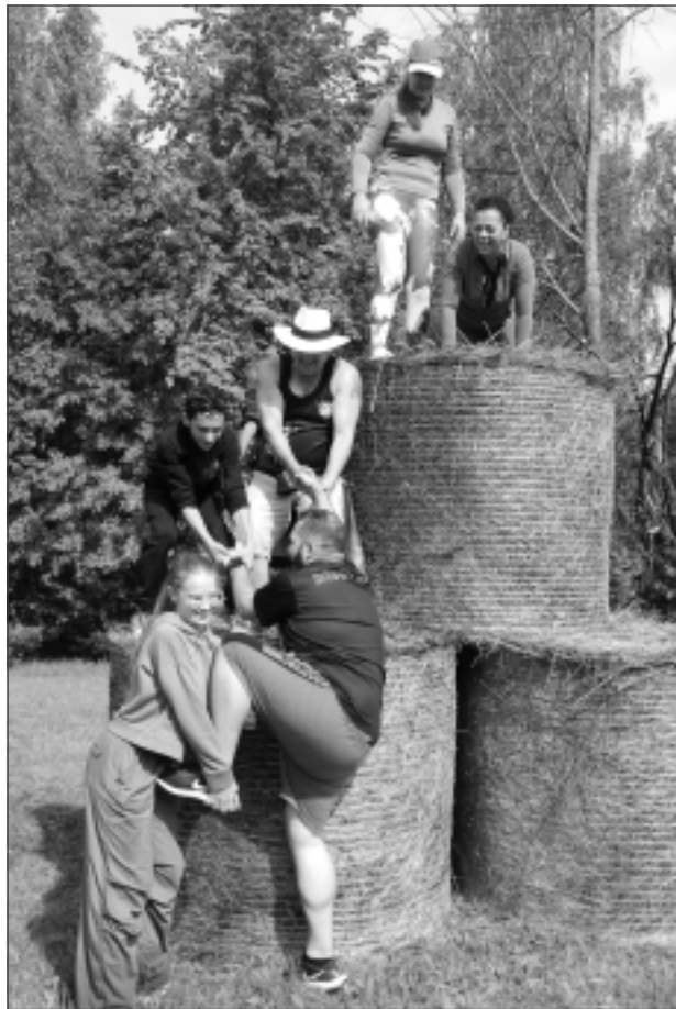
Starptautiskais stipro skrējiens. Pārvarot šķēršļus, Kostarikas komandai steidza palīgā latviete un gruzīns, kuri centās palīdzēt kostarikāņiem uzrāpties uz siena ruļļa. Izdevās!