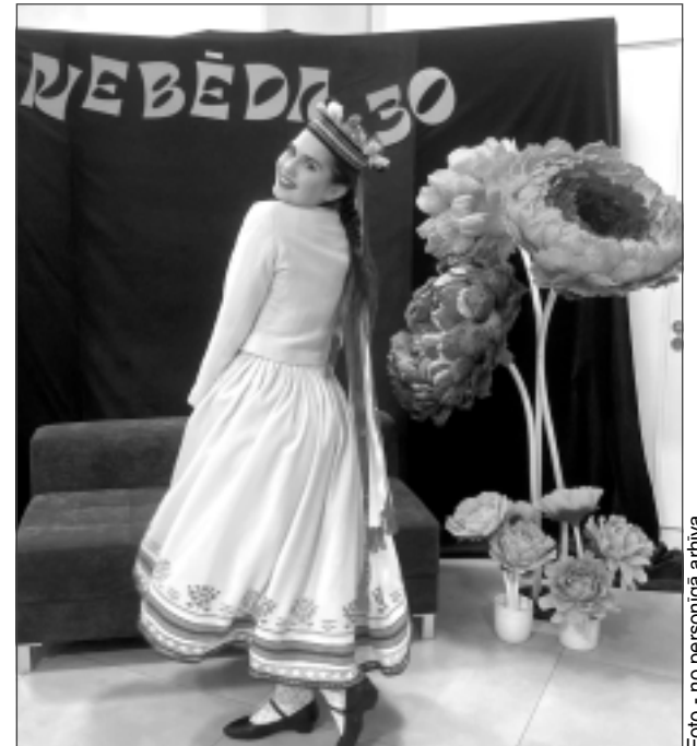
Baltajā Abrenes tautastērpā. Līva jūtas lepna, ka var būt viena no tautas deju dejojām, tērpties skaistā tērpā, dejojot uz skatuves un priecēt skatītājus.

– Domāju, ka lielākajai daļai deju kolektīvu mīļākā deja ir "Ābrama polka". Tā ir ārkārtīgi klasiska un jautra, tieši tāpēc šī deja ir mana mīļākā un patīk visvairāk.