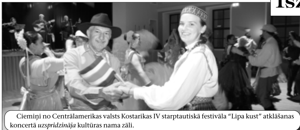
Ciemiņi no Centrālamerikas valsts Kostarikas IV starptautiskā festivāla “Lipa kust” atklāšanas koncertā uzspriecināja kultūras nama zāli.