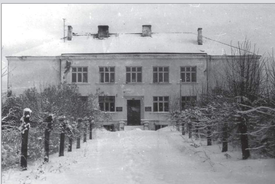
Mirklis no vēstures. Fotografija tapusi laikā, kad skola vēl darbojās.