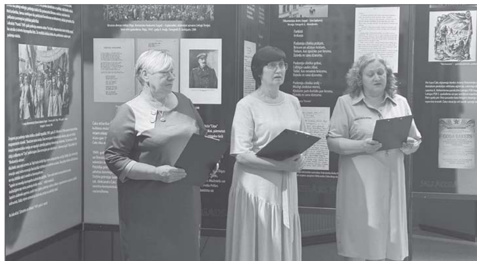
Sagatavo dzejas lasījumus. Naudaskalna amatiereteātra dalībnieces bija meklējušas un atradušas Čaka dzeju, kas ir aktuāla arī mūsdienās.