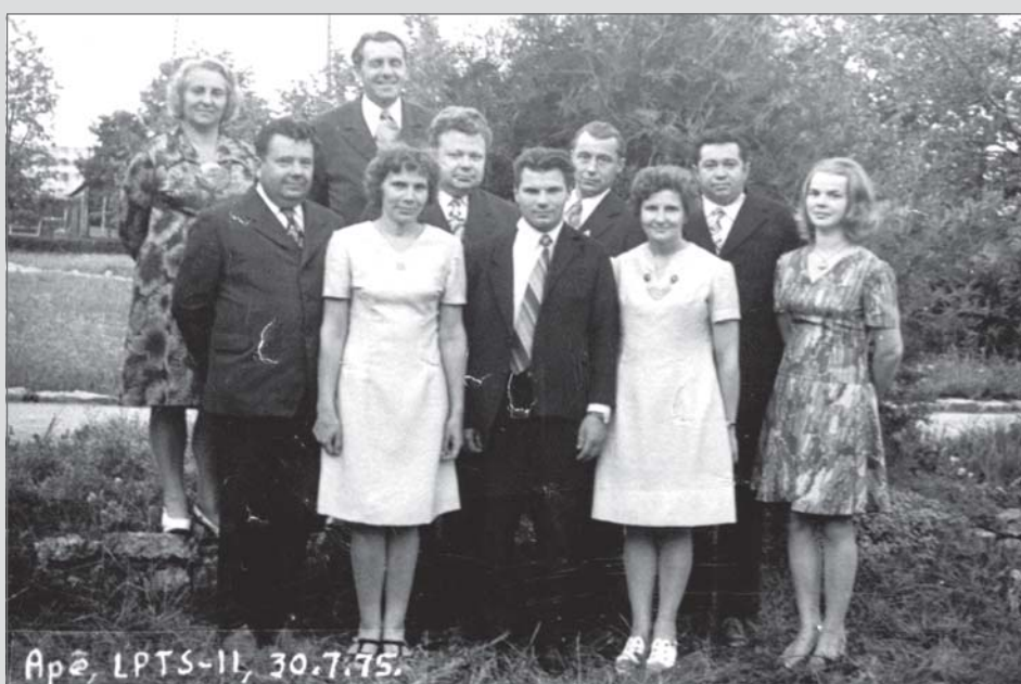
Pedagogi. Pulciņš skolotāju, kuri strādāja 1975.gadā.