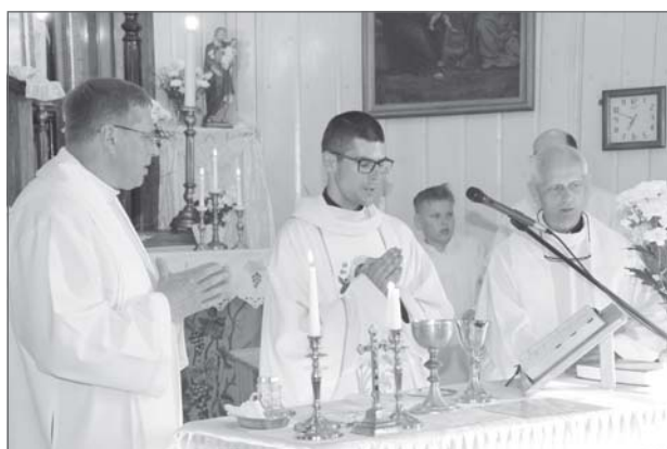
Svētajā Misē. Ikviens no trim priesteriem atrada īstos vārdus, kas uzrunāja, iedrošināja un uzmundrināja klātesošos.