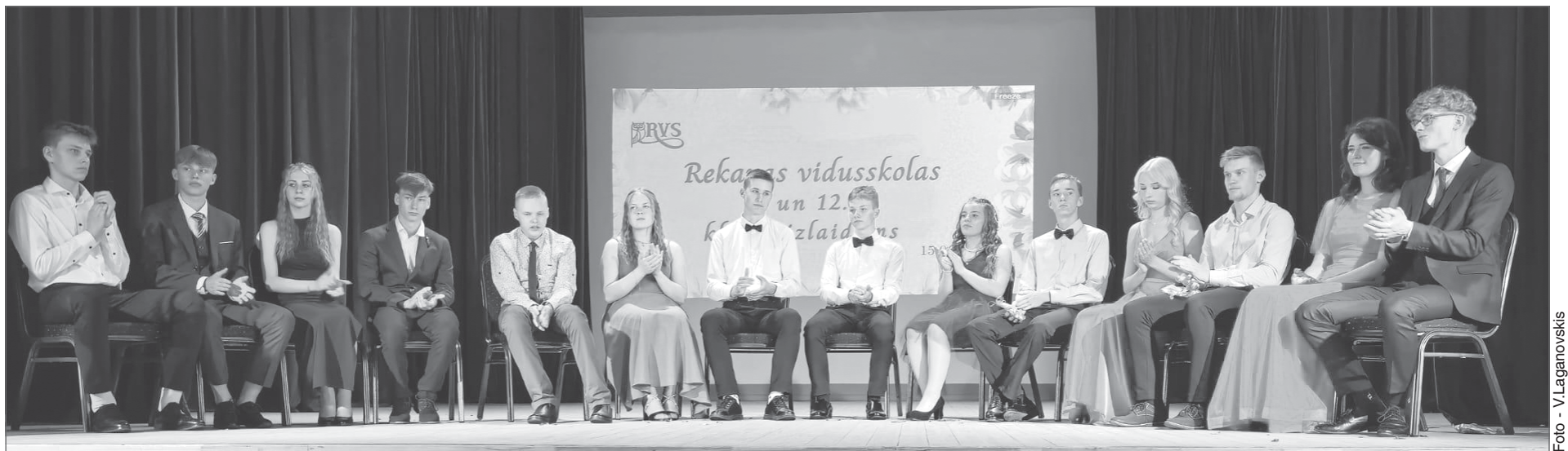
Absolventi uz skatuves. 9. un 12. klašu skolēni noslēguši vienu svarīgu savas dzīves posmu un gatavi sākt jaunu.

Jūnijs ir izlaidumu laiks. 15. jūnijā Rekavas vidusskolas 9. un 12. klases skolēnu vecāki, vecvecāki, brāļi, māsas, radi un draugi pulcējās uz svinīgu pasākumu, lai kopā nosvinētu pamatskolas un vidusskolas posmu noslēgumu.