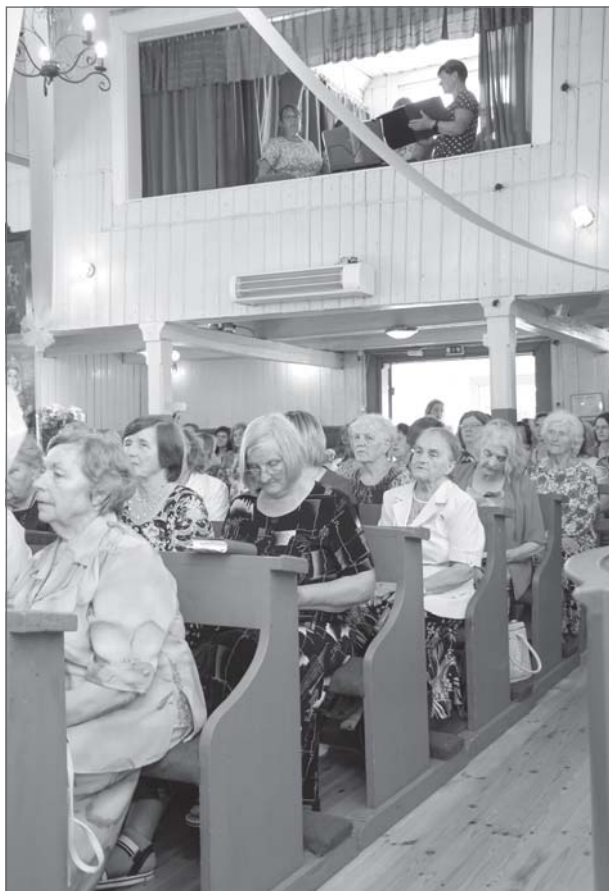
Skan lūgšanas un dziesmas. Ikviens ticīgā sirds precējās par iespēju būt svētkos kopā ar priesteriem un draudzi.