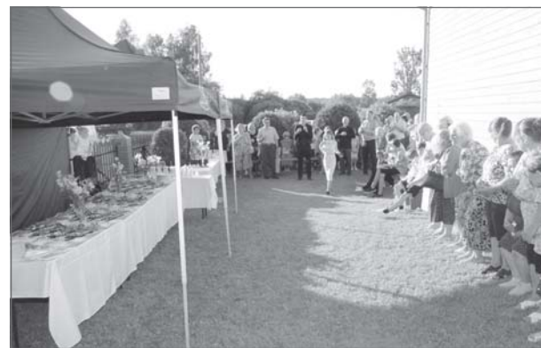
Agape jeb kristiešu sadraudzības mielasts. Svētku noslēgumā ikviens varēja mieloties pie galdiem, ko par draudzes ziedojumiem dāsnī bija sarūpējis “Senda Dz” kolektīvs.