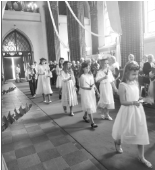
Aizvadītajā svētdienā Viļakas katoļu draudzē Pirmo svēto Komūniju saņēma 15 bērni.