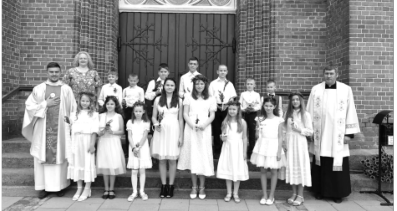
Svētku dienā. Gatavojoties Pirmajai svētajai Komūnijai, kā atklāj skolotāja, bērniem bija daudz jautājumu, bet vissvarīgākais kristīgajā dzīvē tomēr paliek vecāku padoms un piemērs.