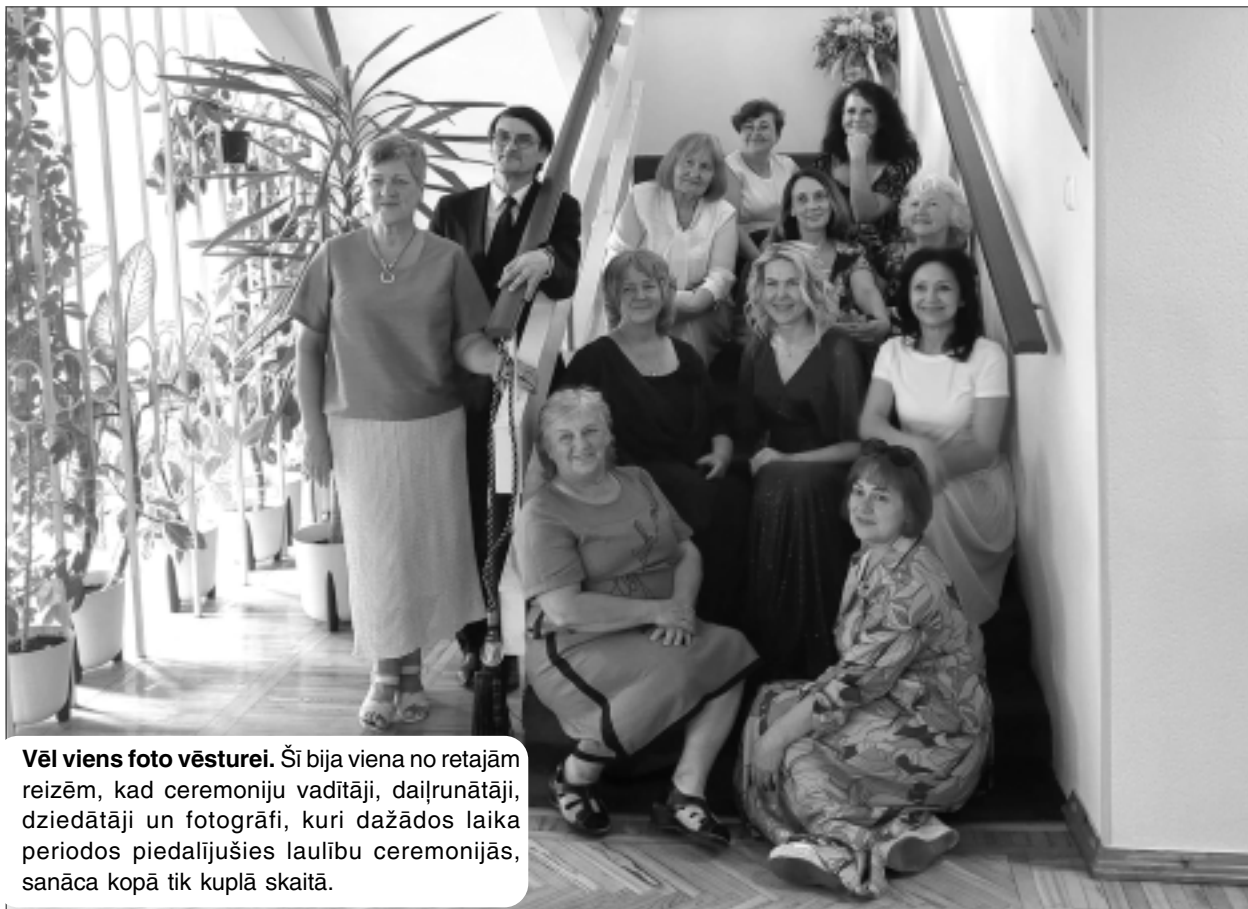
Vēl viens foto vēsturei. Šī bija viena no retajām reizēm, kad ceremoniju vadītāji, daiļrunātāji, dziedātāji un fotogrāfi, kuri dažādos laika periodos piedalījušies laulību ceremonijās, sanāca kopā tik kuplā skaitā.