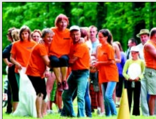
Pirmajos Balvu novada svētkos.