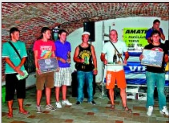
Noslēdzies strībola turnīrs.