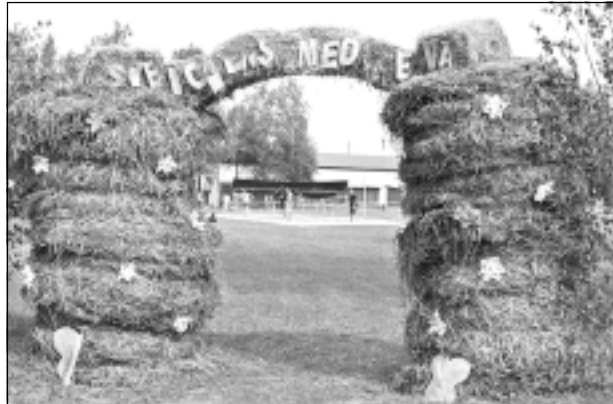
Goda vārti. Ģimeņu sporta dienas dalībniekiem vajadzēja iet cauri goda vārtiem, kas bija veidoti no sienu ķīpām un izrotāti ar krāsainām lapām. Tie izskatījās varen iespaidīgi.