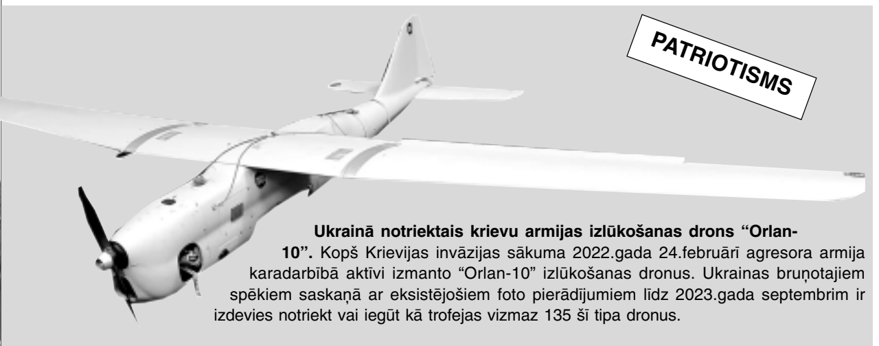
Ukrainā notriektais krievu armijas izlūkošanas drons "Orlan-10". Kopš Krievijas invāzijas sākuma 2022.gada 24.februārī agresora armija karadarbībā aktīvi izmanto "Orlan-10" izlūkošanas dronus. Ukrainas bruņotajiem spēkiem saskaņā ar eksistējošiem foto pierādījumiem līdz 2023.gada septembrim ir izdevies notriekt vai iegūt kā trofejas vizmaz 135 šī tipa dronus.