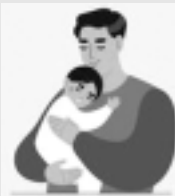
Saņēmēju skaits, tūkstoši

Šī iemesla dēļ 2023. gadā ir ļoti liels pabalsta saņēmēju skaits, tāpat arī tas ietekmēja pabalsta vidējā apmēra rādītāju.