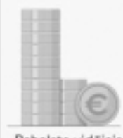
Pabalsta vidējais apmērs, eiro