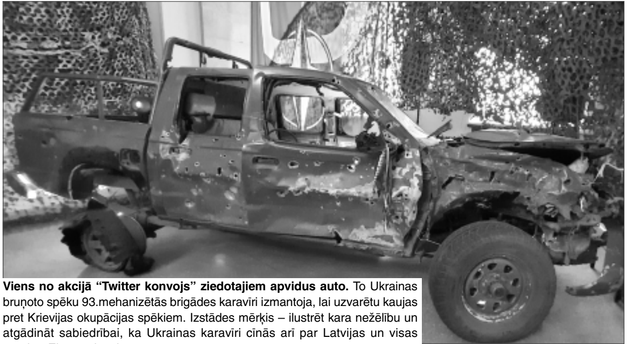
Viens no akcijā "Twitter konvojs" ziedotajiem apvidus auto. To Ukrainas bruņoto spēku 93.mehанизētās brigādes karavīri izmantoja, lai uzvarētu kaujas pret Krievijas okupācijas spēkiem. Izstādes mērķis – ilustrēt kara nežēlību un atgādināt sabiedrībai, ka Ukrainas karavīri cīnās arī par Latvijas un visas pārējās Eiropas brīvību.

Ar vadmotīvu "Zem drošības karoga" šogad apmeklētājus sagaidīja KARA MUZEJS . Plašajās telpās, kas izvietotas vairākos stāvos, apskatei bija pieejamas muzeja pastāvīgās vēstures ekspozīcijas, kā arī jaunākā izstāde "NATO – Tev un Latvijai. Latvijas 20 gadi NATO". Apmeklējot šo muzeju, jāreķinās ar ilgāku laiku, – lai rūpīgi apskatītu visas ekspozīcijas, ar stundu vai divām ir krietni par maz. Izstādes ("Kara anatomija: cilvēka dzīvības vērtība", "Brīvības čuksti: Latvijas neatkarības zaudēšana un atgūšana. 1940/1990", "Latvijas neatkarības karš. 1918-1920" u.c.) vēstija par Latviju tās dažādos laika posmos, Pirmā un Otrā pasaules kara gadiem, par Krievijas Federācijas agresiju pret citām valstīm, par Zemessardzi toreiz un tagad... Pasākuma laikā muzeja viesiem bija unikāla iespēja aplūkot lielāko NATO karogu Latvijā, eksprezidentes Vairas Viķes-Freibergas NATO samītā Prāgā 2002.gada 21.novembrī vilkto kostīmu, 2006.gada Rīgas NATO samita tribīni un citas vēstures liecības par Latvijas valsts ceļu pretī dalībai pasaulē spēcīgākajā militārajā aliansē. Tikmēr mazākie apmeklētāji varēja iepazīties ar muzeja jauno tēlu – kaķi Seržantu – un kopā ar viņu izstaigāt muzeja izziņas taku.