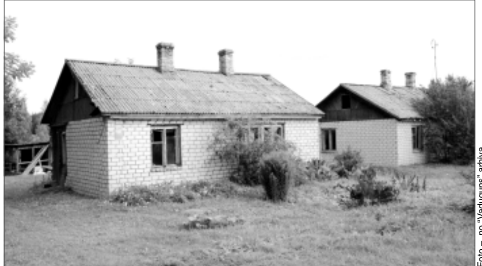
Īpašums Liepu ielā. Kāds Skujetnieku ciema iedzīvotājs joprojām uztraucas, ka īpašuma apsaimniekotāji nepļauj zāli tik bieži, cik vajadzētu.