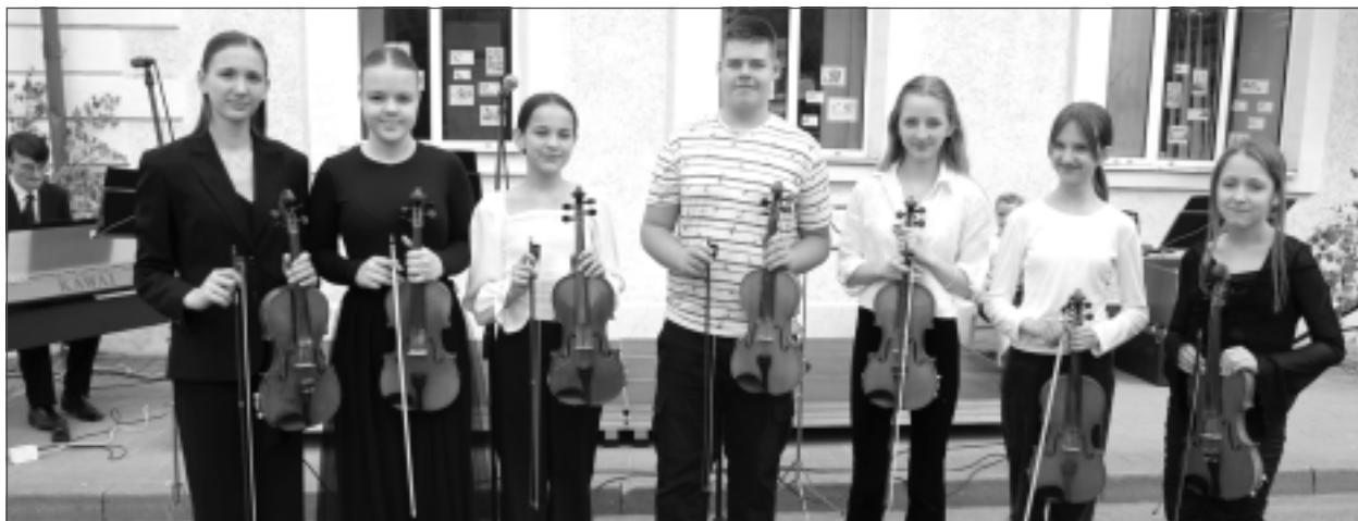
Spēlē vijolnieks... Balvu Mūzikas skolas vecāko klašu vijolnieku ansamblis apliecināja, ka ir labākie.