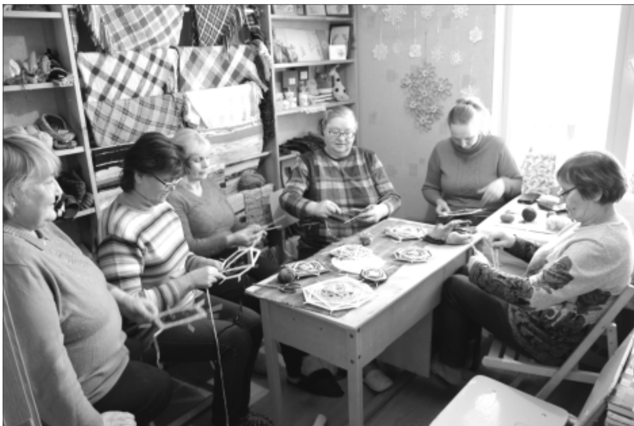
Mandalās ievij savu noskaņojumu. Pirmajā pavasara mēnesī – martā – briežuciemiešu iepriekšējā gada veikumu, tostarp dzijas mandalas, izstādē varēs aplūkot arī balvenieši un citi novada iedzīvotāji.