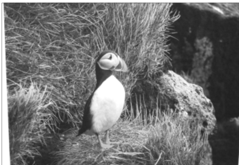
Jūras greznais putns. Lai nokļūtu līdz šādam skatam, tūristi Islandē brauc traktorīnā pa aptuveni metru dziļu ūdeni, pēc tam pa melnajām vulkāniskajām smiltīm okeāna tuvumā, tad ceļotāji uzkāpj vietā, kur dzīvo šie jūras putni, vēro tos un fotografē.