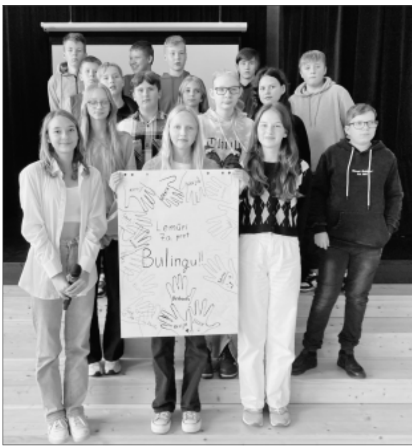
Lielformāta plakāts. Klašu grupas veidoja lielformāta plakātus, kas atgādinās, ka katrs skolēns ir apņēmies nepieļaut emocionālu un fizisku vardarbību.

Viens no programmas "KiVa" nosaukumiem ir oficiāls programmas atklāšanas un uzsākšanas pasākums skolās. Antibulinga programmas "KiVa"