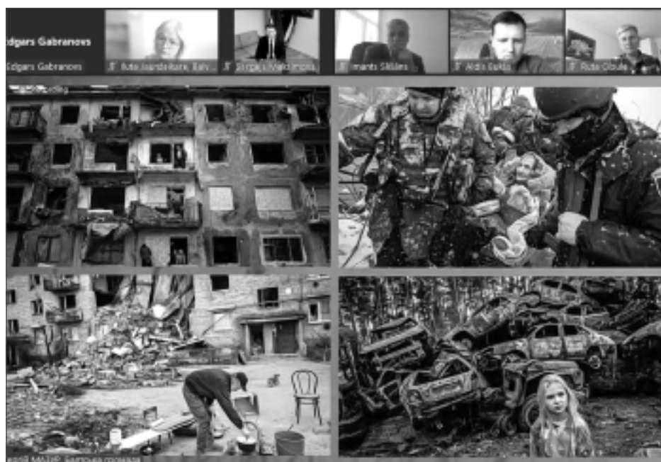
Postaža. Pilsēta vienmēr pieminēs 42 jaunu cilvēku vārdus, kuri krituši frontē.