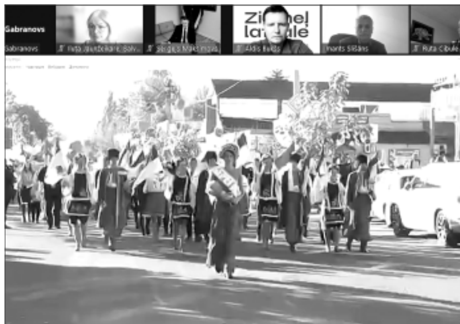
Pirms kara. Iedzīvotāju skaits: Baltā – 18 079 (2021.gada dati); Balvos – 5 699 (2022.gada dati, novadā – 11 261). Attālums: 1603,87 km (1035 km); braucot ar auto – 12,9 stundas; lidojot – 1,2 stundas.