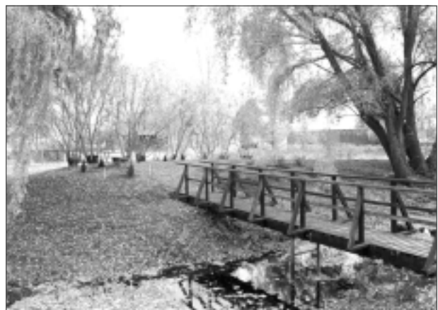
Baltinavas parks. Tilts uz Mīlestības pussaliņu.

Katrā ziņā parkā izvietojami informatīvie stendi, lai pie izejas apmeklētāji jau zinātu, kas tas ir. Estrādi noteikti nepieciešams saglabāt, bet derētu arī nedaudz atjaunot. Tāpat