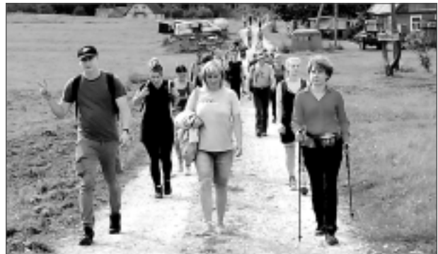
Lauku ainava ar pievienoto vērtību. Izejot no Tepeničas ciema pie “Cīrulišiem”.