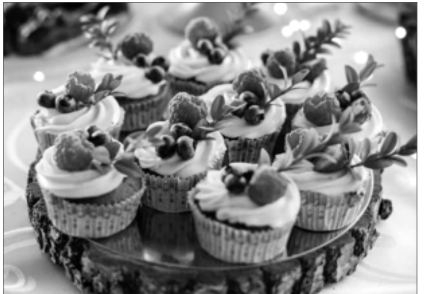
Ķirbju mafini. Kārumi, kas asociējas ar rudeni.

– Šobrīd ir rudens sezona, tādēļ, domāju, katrai saimniecei “Ķirbju mafinu” recepte būs pa spēkam, lai, piemēram, svētdienas rītā pārsteigtu mājiniekus.