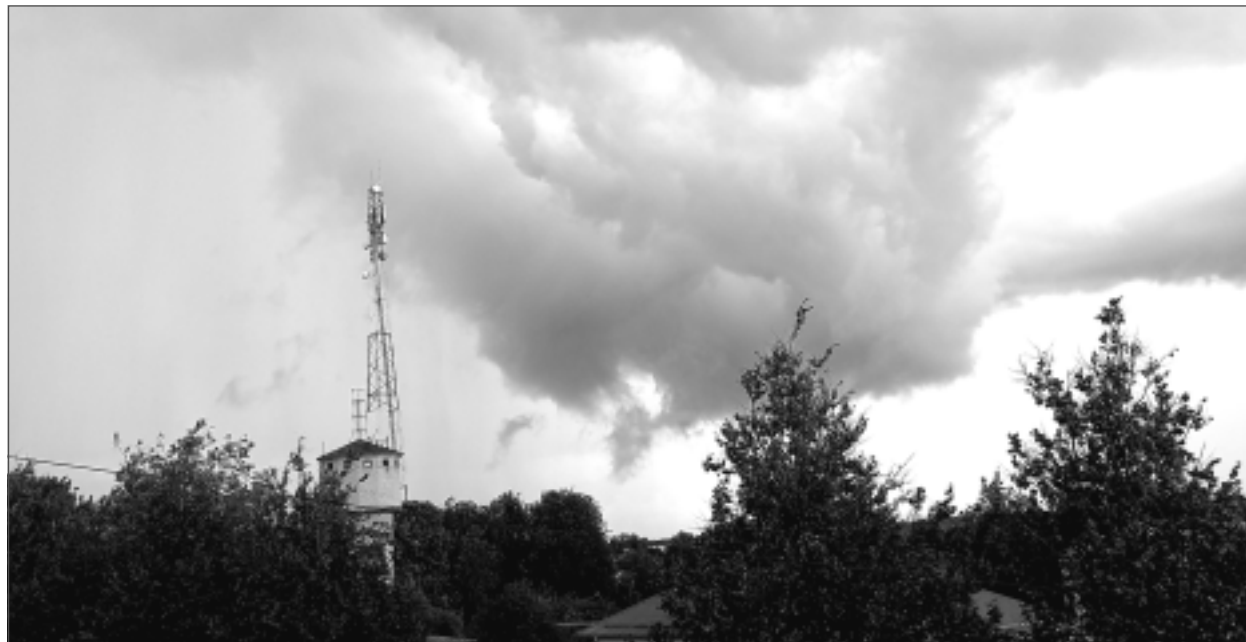
Negaiss. Iesūtīja Rūdolfs Kozlovs no Balviem.

Katra mēneša labākās fotogrāfijas autors saņems balvu. Fotogrāfijas var iesūtīt pa pastu – Balvi, Teātra ielā 8, LV-4501, vai elektroniski – vaduguns@apollo.lv. Pie foto obligāti norādāms vārds, uzvārds (vēlams - tālrunis).