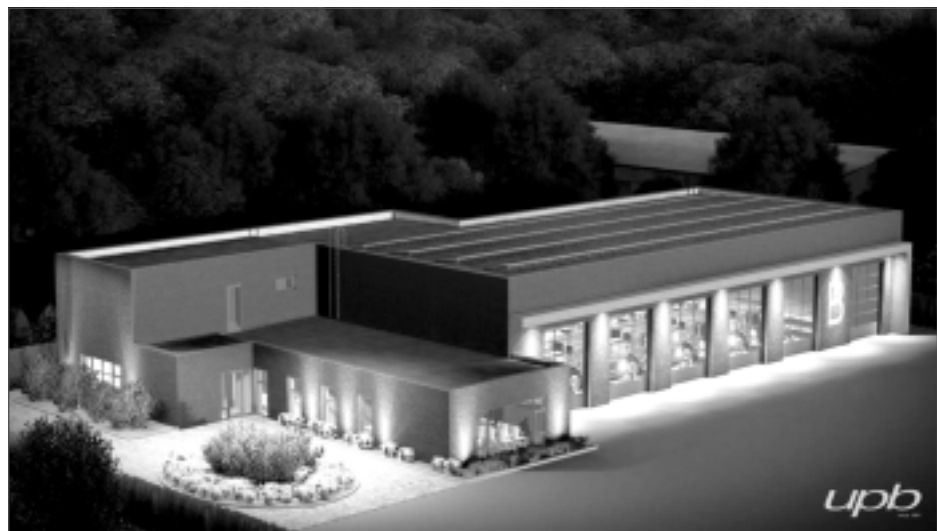
Vīzija. Jaunās ēkas plānotā platība – 2950 m 2 .

zemi, bet neoficiālā informācija liecina, ka starta cena ir 100 000 eiro. Es, iespējams, izplatu baumas, tomēr šī summa mums nav pieņemama. Viens ir skaidrs, zeme būs jāmeklē, ja gribam, lai Balvos taptu katastrofu centrs. Žurnālists man pāradresēja kādas kundzes jautājumu, – vai viņa nodzīvos līdz laikam, kad centru uzbūvēs? Vai 100 000 eiro ir summa, par kuru mēs gatavi runāt? Drīzāk nē. Meklēsim risinājumu. Ja viss mums ies raiti, tad, iespējams, nākamgad sāksies būvniecība. Tā ir ļoti optimistiska prognoze.”