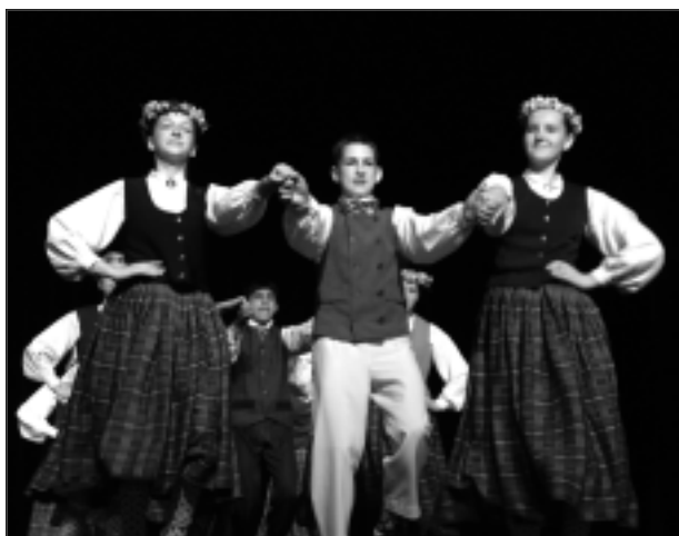
Dejo no sirds. Kā vienmēr, lieliski nostrādātu un emocionāli piepildītu sniegumu rādīja Stacijas pamatskolas deju kolektīva “Cielaviņa” 5.-9.klašu dejotāji.