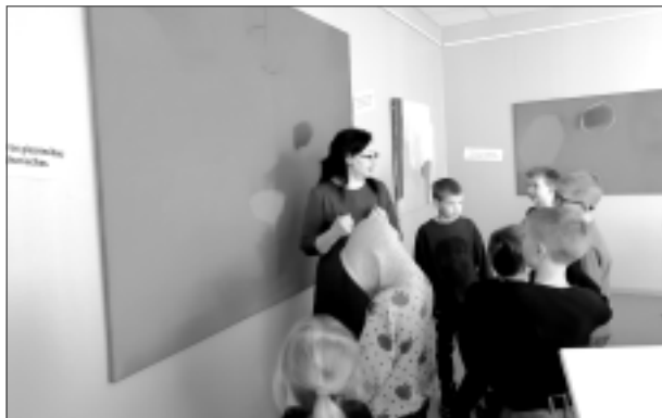
Mācās izprast abstrakto mākslu. Rugāju skolēni ar interesi aplūkoja šobrīd mākslas skolā skatāmo vācietes Erdmutes Blahas gleznu izstādi, cenšoties saprast, kādas sajūtas viņos raisa šie darbi. Pēc tam katrs izvēlējās gleznu, kura patīk vislabāk.