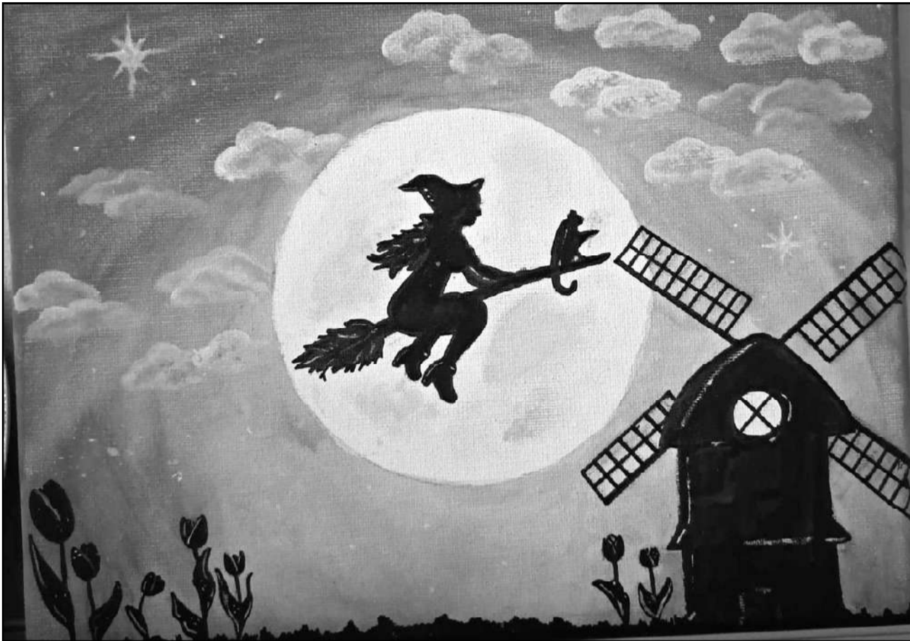
Mazmeitas zīmējums. Ausmas vecākā mazmeita ļoti labi zīmē. Zinot vecmammais aizraušanos ar raganiņu kolekcionēšanu, mazmeita viņai uzdāvināja zīmējumu, kurā attēlota uz slotas lidojoša ragana.