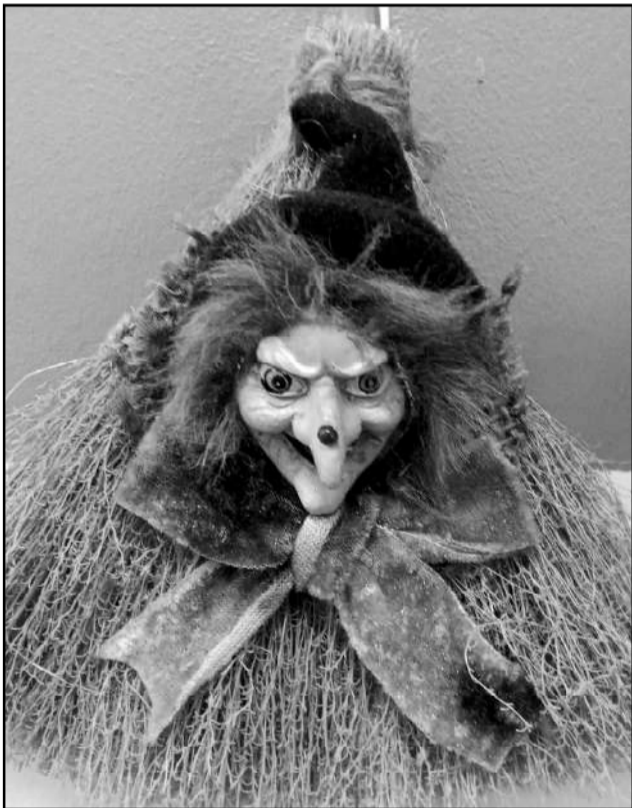
No visdažādākajiem materiāliem. Raganas Ausmas kolekcijā ir no visdažādākajiem materiāliem – auduma, māla, salmiem, virvītēm u.c.