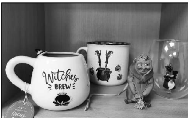
Ari citi suvenīri. Ausmas kolekcijā ir ne tikai suvenīri–raganas, bet arī krūzītes ar zīmējumiem un grāmatas par ragana.