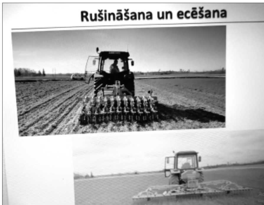
Rušīšana un ecēšana

Pētījumam izvēlējās auzu, rudzu un zirņu laukus, nezāļu apkarošanai pielietojot ecēšanu un rušīšanu. Saimnieks vērtē, ka katram šim variantam ir savi plusi un mīnusi. Ar rušīšanu rindstarpās nezāles var ierobežot ļoti labi, ja tikai var nodrošināt tehnoloģisko savietojamību, lai sakrīt to platumi. Saimnieka vērtējums ir: "Bija redzams, ka sējumi paliek veselīgāki un spēcīgāki, graudu pārbaude apliecināja labu kvalitāti. Problēma manā konkrētajā gadījumā bija agregātu savietojamība, jo sējmašīnai bija savs platums, kam nācās pielāgot rušīnātāju. Noteikti nepieciešama tehnoloģiskā sliede. Zirņu rušīšanai ir ļoti īss laiks, var paspēt to izdarīt vienu reizi, jo zirņi ātri aug un saķeras. Zinu, ka citu saimnieku pieredze liecina, ka ļoti veiksmīgi var rušīnāt rapsi, ripsi un pupas, un šī metode nezāles burtiski izravē. Pasaulē ļoti veiksmīgi izmanto sēšanu ar rušīšanu. Mana pieredze liecina, ka saimniecībā ir jākombinē abas metodes, dienā apstrādājot 40-50 hektārus, lai visu paspētu izdarīt savlaikus. Vēroju, ka ecēšana veiksmīgi izņem vārpas, bet ar rušīšanu labi apkarot dažādas daudzgadīgās nezāles, kā usni, ierobežojot tās turpmākās augšanas spēju. Izmaksas