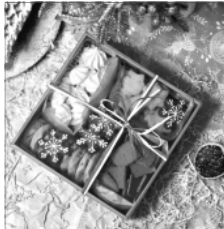
"Gustiņa" piparkūkas. Tuvojas Ziemassvētki, kur viena no noteicošajām un vadošajām ir piparkūku smarža. Ar lielu atbildības sajūtu tās cep un dekorē arī "Gustiņš".