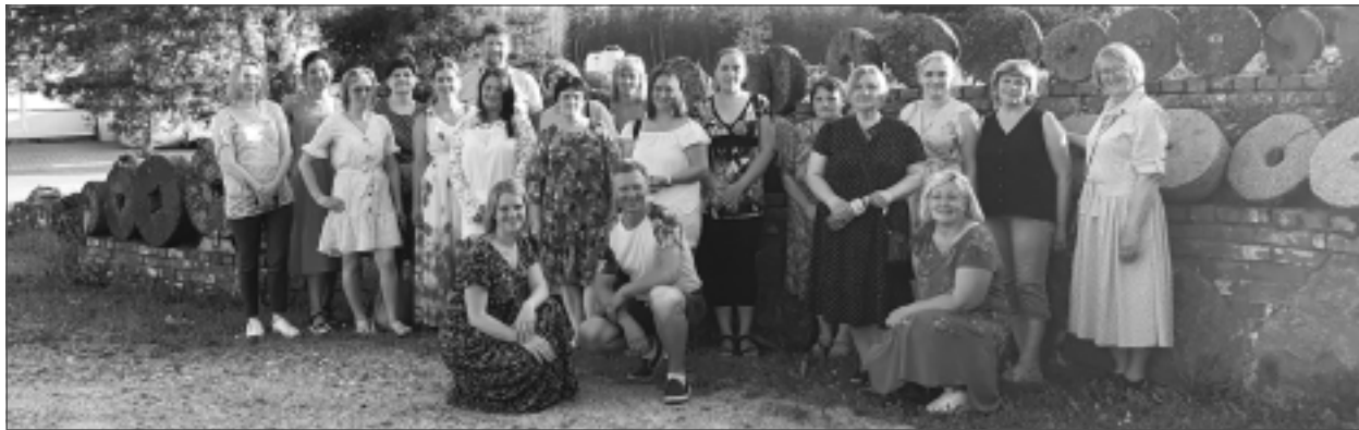
Ciemojas "Kotiņos". SIA "Valrito" kolektīvs ekskursijā "Kotiņos" Balvu novadā. Pēc tam uzņēmuma darbinieki apmeklēja Rekovas dzirnavas, kur nobaudīja šejienes saimnieču gatavoto. Garšu bodītē "Gustiņš" Alūksnē, kur uzņēmums piedāvā savu produkciju, tiek tirgota arī citu Latvijas ražotāju produkcija, un "Kotiņi" ir viens no tiem.

– Profitoroļi ir eļļā vārītas mīklas pārslīņas, ko pieliek klāt, pasniedzot buljonu. Alūksnes pusē šis produkts saglabājies, šeit tas vienmēr bijis kā godu ēdiens. Tas ir produkts, ko ražojam, jo mums Alūksnē ir kafējnīca. Ražojam arī kā produktu tūristiem, ko nopirkt un paņemt līdzi no Alūksnes. Līdzīgi ir arī ar kūciņām burciņā. Ja par malēniešiem mēdz teikt, ka viņi gaismu nes istabā ar maisu, tad mēs piedāvājam istu torti mazā burciņā. Mūsu jaunums ir kūciņa "Ziemas garša". Mēs to noķērām un ielikām burciņā, dodot iespēju katram izbaudīt ziemai raksturīgās saldās garšas, ko rada pikantais piparkūku biskvīts, mandarīnu ievārijums, apelsīnu – putukrējuma krēms. Tā mēs tirgojam tortes burciņā, katram