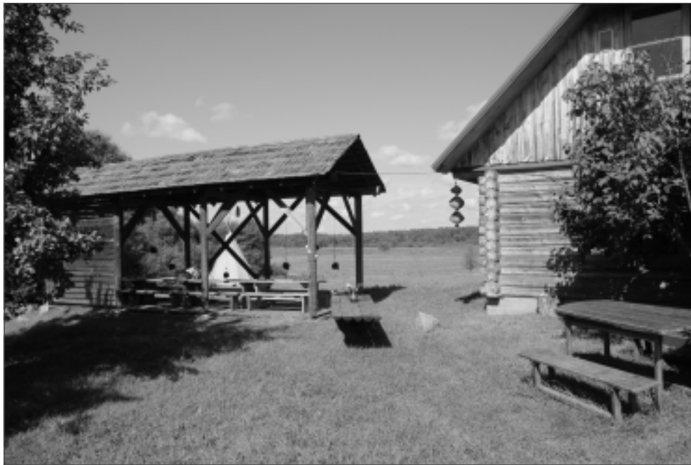
Skats no Putnu salas informācijas centra pagalma. Daugavas kreisajā krastā, Augšzemē, atrodas Dvietes paliene. Tur ir dabas parks gandrīz 5 tūkstošu hektāru platībā. Vienreizēja dabisko upju palienu teritorija, kur var mielot acis, vērojot putnus, savvaļas zirgus un liellopus.