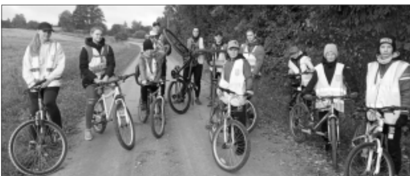
Lai vairāk var pagūt. Baltinavas un Rekasas jaunsargi izvēlējās doties ceļā, braucot ar velosipēdiem. Tas deva iespēju aplūkot vairākas vēsturiskas vietas Šķilbēnu pagastā, pacīmoties saimniecībā "Stabļovas ķiploks" un noskatīties kinologa un suņa paraugdemonstrējumus.