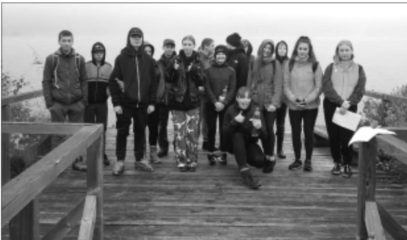
Pēc pārgājiena. Bērzpils pamatskolas, Rugāju vidusskolas un Balvu Valsts ģimnāzijas jaunsargi par pārgājiena vietu izvēlējās Lubānas ezera gleznaino krastu.