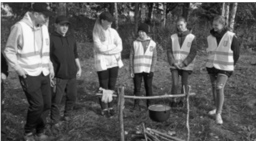
Pašu vārīta zupa – visgardākā. Pārgājiena uzdevumu sarakstā bija arī patstāvīga ēst gatavošana. Baltinavas un Rekasas jaunsargi ne tikai savāca apkārtnē atrodamo kurināmo un iekūra ugunsgrūdu, bet arī patstāvīgi uzvārija zupu.