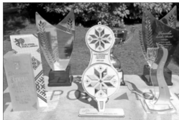
Saņem apbalvojumus. “PRO.ini” saņēmuši gan biedrības “Ritineitis” organizēto Ziemeļlatgales NVO Gada balvu kā sportiskākā nevalstiskā organizācija, gan citus apbalvojumus, kas liecina, - darbs ir novērtēts.

Otrs svarīgs pozitīvo iniciatīvu biedrības “PRO.ini” darbības virziens ir dažādu moderno tehnoloģiju iedzīvināšana aktīvās atpūtas pasākumos brīvā dabā, lielākoties orientēšanās sporta vai dažādu orientēšanās spēļu veidā. Pirms desmit gadiem tika izveidota arī neformāla orientēšanās draugu kopa “Baisie Eži”, kurai pievienoties un kuru pārstāvēt var ikviens, bez vecuma vai meistarības ierobežojumiem. Arī šajā ilglaicīgajā projektā mums ir daudz draugu