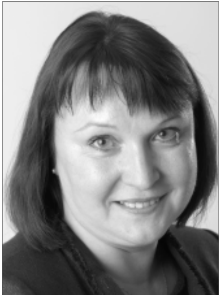
INESE LAIZĀNE, bijusī Saeimas deputāte

Atbildot uz šo jautājumu, uzreiz varu teikt, – tā ir nekorekta un diezgan nepamatota prasība. Ir dažādas izglītības formas, un nav skaidrs, kurā brīdī tad mēs uzskatām, kura līmeņa no tām ir augstākā izglītība, un kura