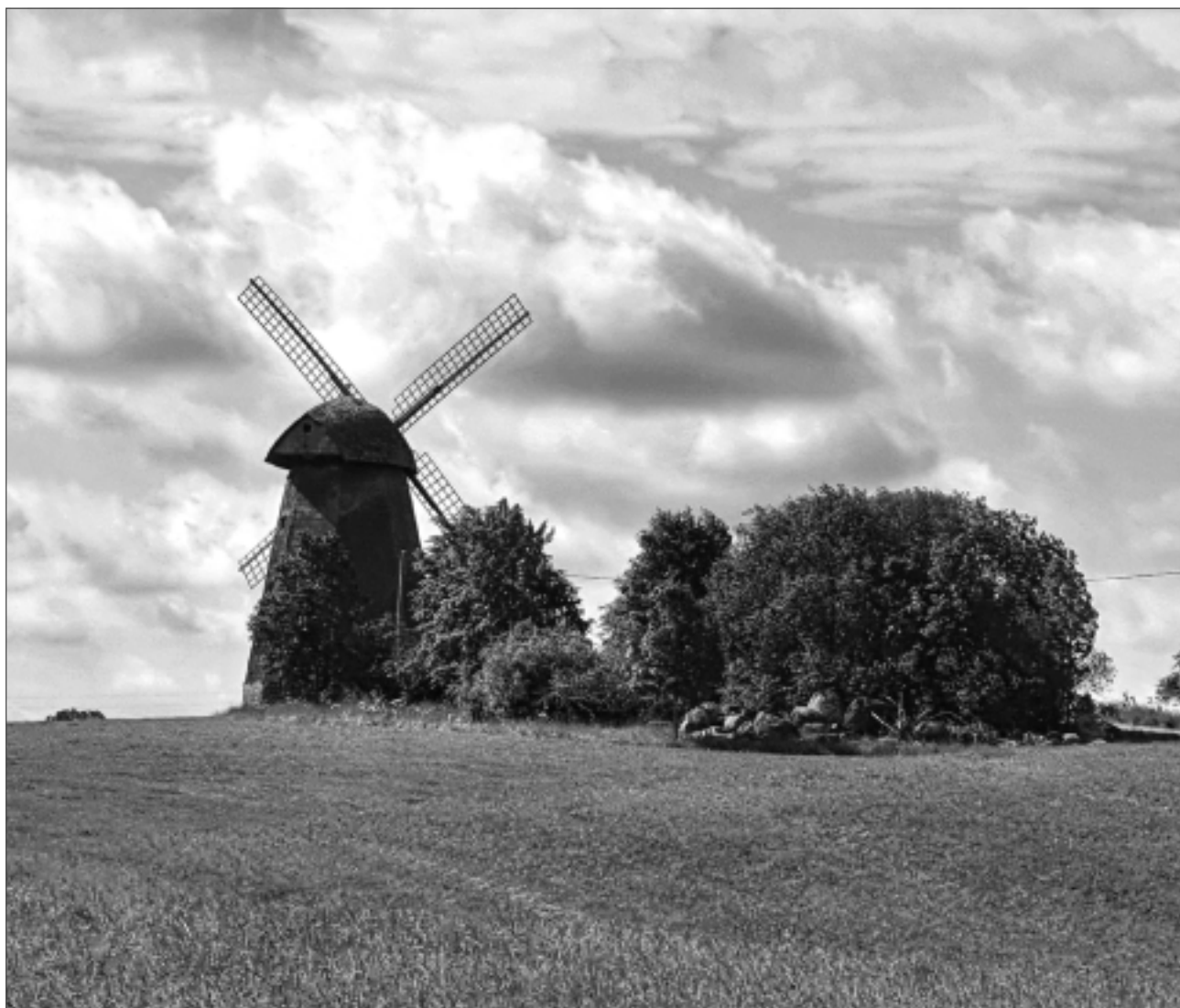
Kā baravika meža. Spāni atjaunoti 2012.gadā pēc tam, kad 2010.gada ziemā vējš tos nolauzis.