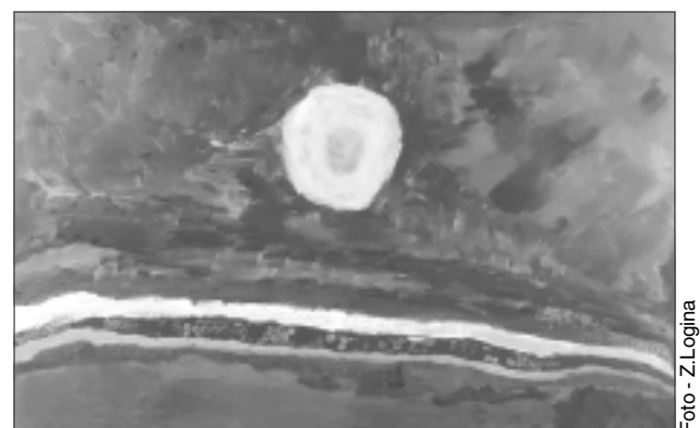
Saulriets. Sarkanās, dzeltenās un zilās krāsas mijiedarbība liek apstāties pie gleznas un sajūties kā pie dabas.