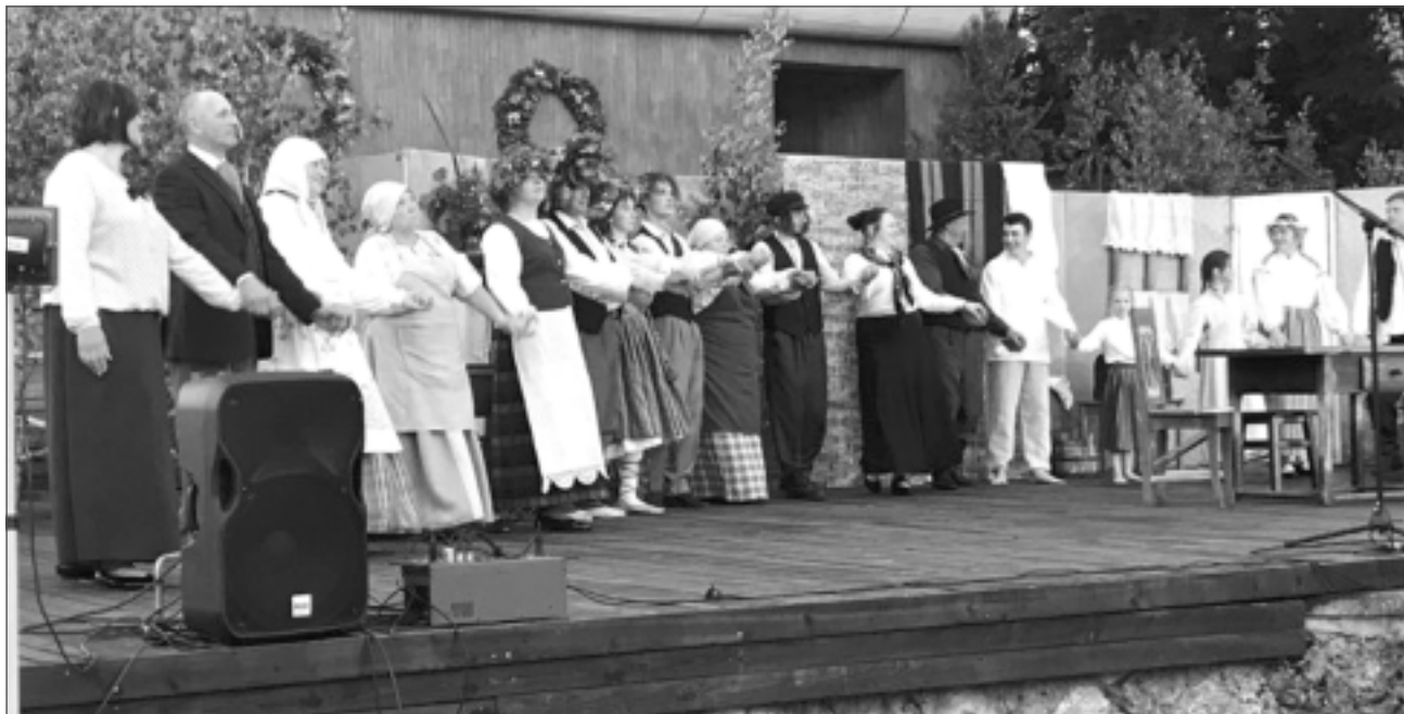
Silmaču mājas pagalmā. Meijām un vainagiem rotāta skatuve, ziedi aktieriem no izrādes apmeklētāju rokām radija istu Līgo svētku noskaņu ne tikai baltinaviešiem, bet arī ciemiņiem - skatītāju solu rindas bija pilnas.