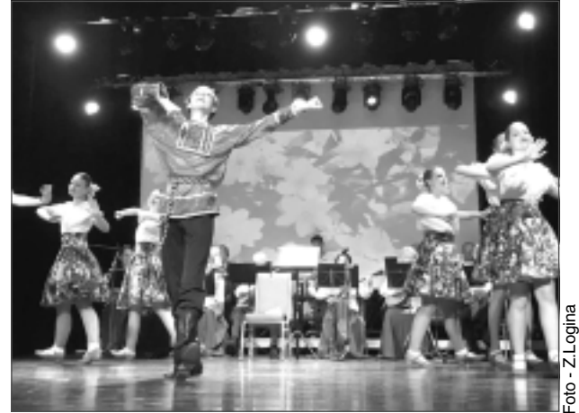
Jestrie dejojāji. VEF Kultūras pils deju grupa izpelnījās skatītāju aplausus gan par jestro sniegumu, gan greznajiem un koloritajiem tērpiem.

“Neskatoties uz grūtībām, uzdrošinājāties aicināt VEF