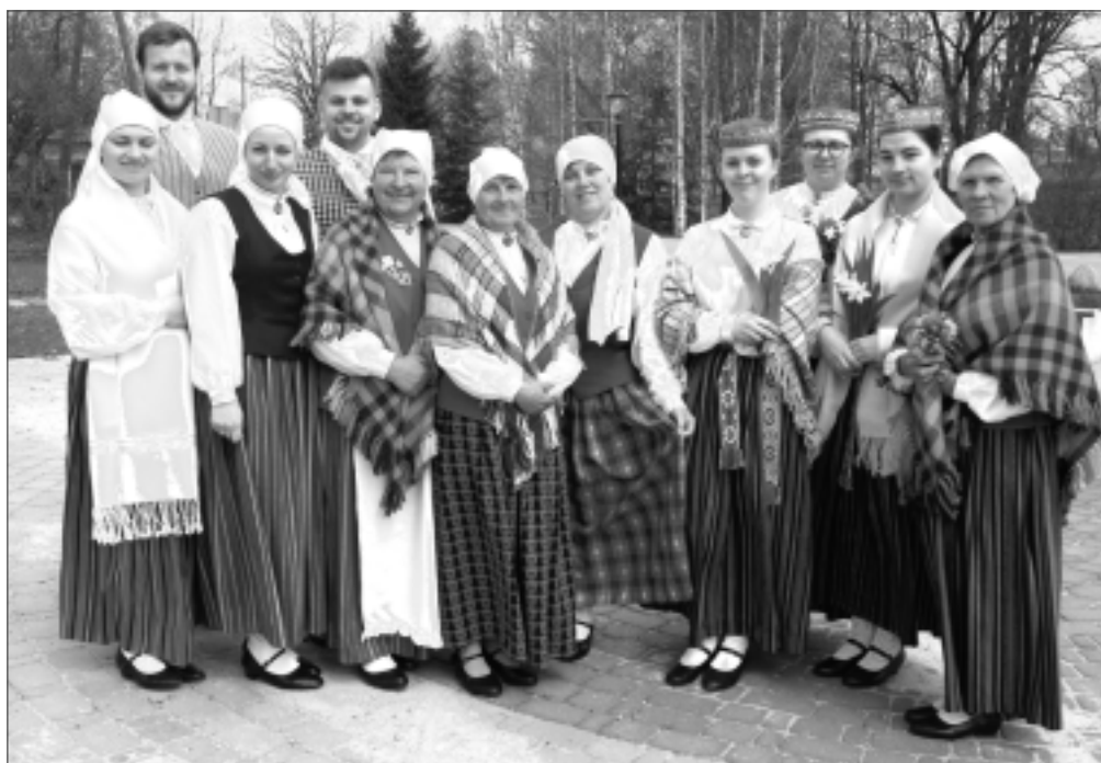
Vēsturiskajā laukumā. “Nobildējiet mūs, mēs no Briežuciema,” jokoja “Soldan”.

Ludzas amatnieku centra pārstāvji vēlēja turēt savu lepnumu un godu. Jautāti, vai daudzi nav nolaiduši rokas, ludzānieši atzina, ka pasaulē iestājies sarežģīts laiks: “Apkārt daudz būdu, tāpēc nereti garastāvoklis nav tik spožs. Jābūt spēcīgiem, lai godu noturētu! Jālūkojas saulītē, jādama labas domas un jāatceras, ka tu neesi viens. Lūk, cik mūs šodien ir daudz...”