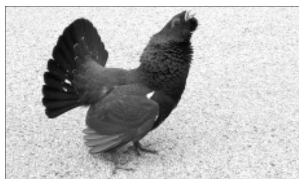
Skaistulis. Medžiem sācies rieta laiks, un tie izturas diezgan pārdoši – izrādās uz ceļiem, var uzliidot pat stabā vai uzklupt cilvēkam.

Kādos pasākumos, ko organizē Litenes LOB grupa, putnu vērotāji var iesaistīties šogad? Ir zināmas šaubas par ziemeļpūces ekspedīciju aprīlī, jo tās izplatības areāls ir pierobeža, bet robežsargi negrib, ka naktī kāds staigā gar robežu, vēl jo vairāk šajā laikā. Toties baltkakla mušķērāja ekspedīcija Vecpededzē notiks noteikti. Jūnija vidū Gulbenes novadā, vieta vēl tiks precizēta, notiks nometņu un semināru dalībnieku saiets. Tajā aicināts piedalīties ikviens interesents, kurš kaut reizi ir piedalījies vai plāno piedalīties kādā no LOB Litenes grupas aktivitātēm. Vēl šogad plāno dienas un nakts plēšīgo putnu monitoringu, Latvijas ligzdojošo putnu uz-