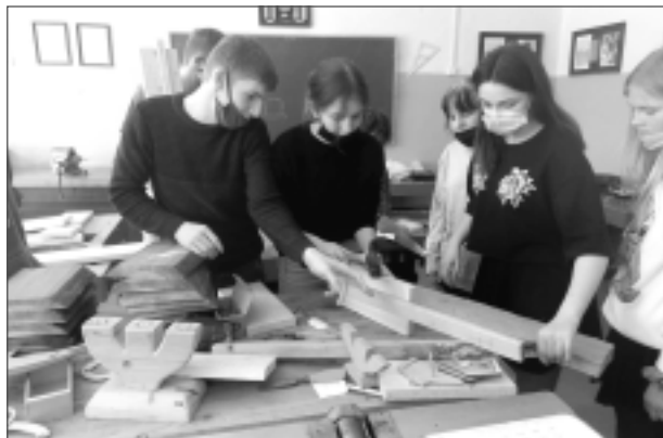
Neatpaliek no puišiem. Meitenes būrišu izgatavošanā neatpalika no puišiem.