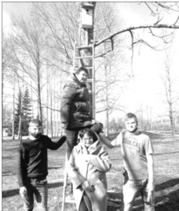
Uzliek vēlamajā kokā. Jaunos būrišus bērni izlika iepriekš izraudzītajos kokos.

Gatavojoties pasākumam, Stacijas pamatskolas Viksnas filiāles skolēni zīmēja dažādus putnus. Labākos sešus darbus nosūtīja uz novada rīkoto konkursu "Putni". 3., 4., 5.klases skolēni, pildot grupās dažādus atjautības uzdevumus, nostiprināja savas zināšanas par putniem un to dzīvi.