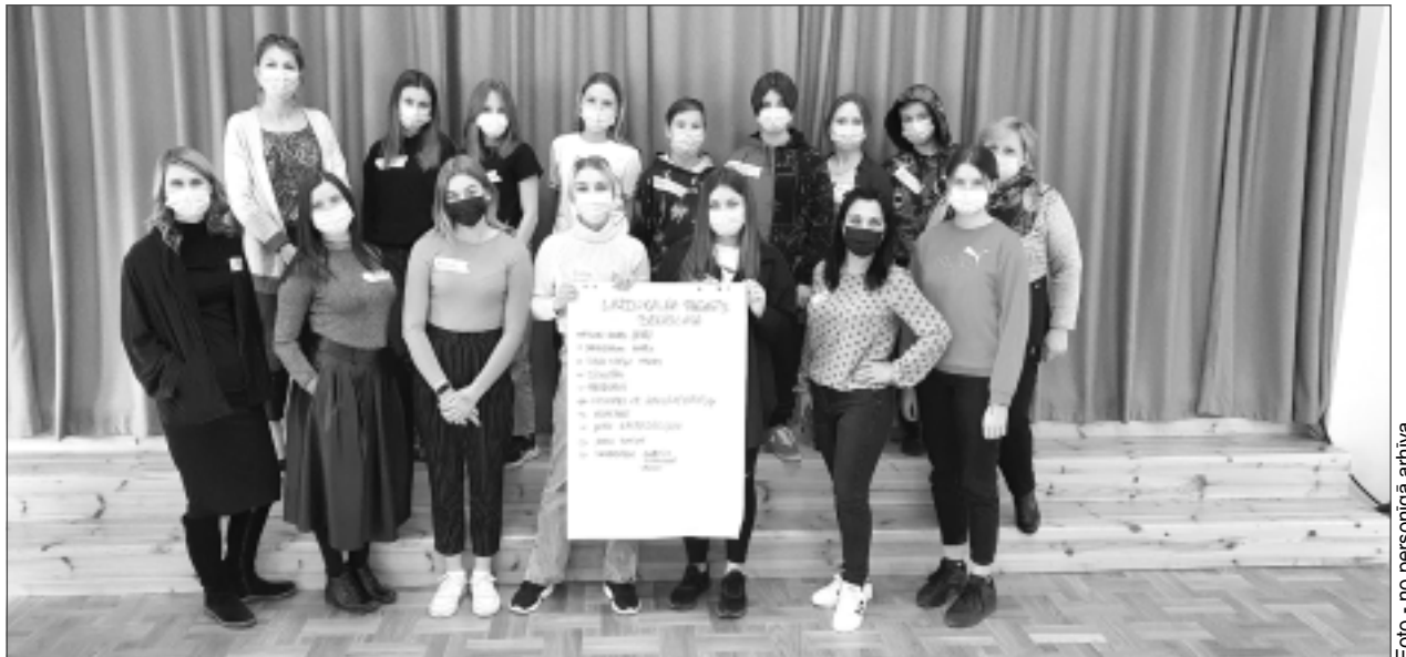
Gatavi sadarboties. Pirmajā pieturas vietā Beņislavā, Eglaines pamatskolā, centra pārstāves sagaidīja ar lielu entuziasmu. Skolēni piedāvāja savas sadarbības idejas un pauda vēlmi iesaistīties kopīgās novada aktivitātēs.

kategorijās. Drīz pašpārvaldē lemsim, kurā dienā apbalvosim šos cilvēkus," atklāja skolas viceprezidente.