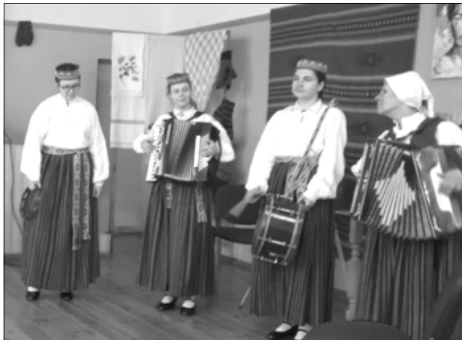
Tikšanās atklāj ar dziesmām. Diskusijas dalībniekus iepriecināja Briežuciema jauniešu folkloras kopa “Soldoni”.

Diskusijas rezultāti: izteiktās atziņas un ierosinājumus nodos konferences rīkotājiem – Eiropas Parlamentam, Padomei un Eiropas Komisijai. Pavasarī šīs iestādes nāks klajā ar secinājumiem un sagatavotām norādēm par Eiropas nākotni.