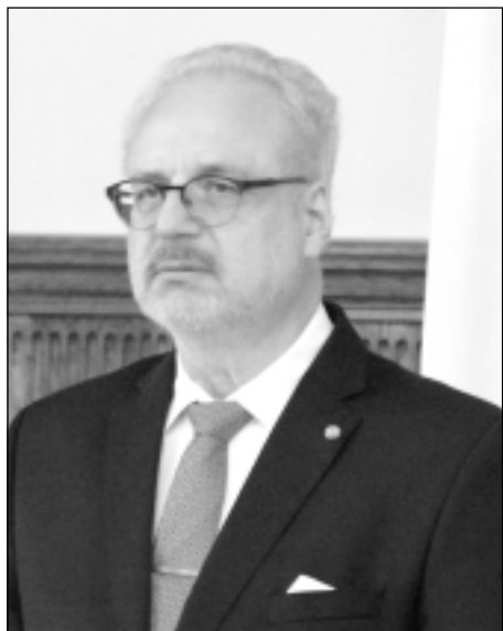
EGILS LEVITS , Valsts prezidents

Rūpīgi sekojot līdzi Politisko organizāciju (partiju) finansēšanas likuma piemērošanai, uzskatu, ka nepieciešams veikt likuma grozījumus. Latvijas politiskajā praksē ir diezgan tipiski, ka politiskās partijas (un jo īpaši jaunas partijas) pēc ievēšanas Saeimā var zaudēt savu pārstāvniecību tajā vai pat sabrukt, no tās saraksta ievēlētajiem kļūstot par neatkarīgajiem deputātiem. Tas nozīmē, ka šāda partija vairs nespēj pilnvērtīgi īstenot vēlēšanās iegūto uzticības mandātu. Tādēļ nav jēdzīgi šādai partijai ar sabrukumu pārstāvniecību Saeimā saglabāt valsts budžeta finansējumu pilnā apmērā.