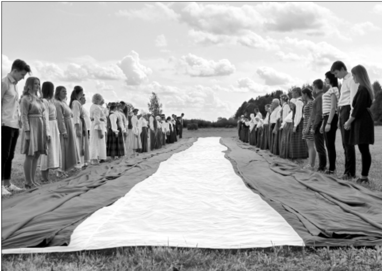
Godina ar Latvijas karogu. Šo svinīgo mirkli Alvils fotografējis Aizpurves ciemā, kad atklāja apraides torņa pamatus.