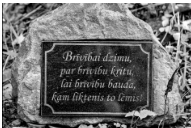
“Brīvībai dzimu, par brīvību kritu...” Rudens lapu ieskauts pieminēklis Stompaku purvā nacionālo partizānu piemiņai.

Tie, kam fotomāksla nav hobijs un viņi ar to nenodarbojas, pat prātā neienāks, cik laika jāpavada, lai noķertu labu kadru. “Ikdienā redzam, cik apkārt ir skaisti – zied ziedi, lido bitītes, bet, ja paņem rokās telefonu vai fotoaparātu un vēlies iemūžināt kadru, skatījums izmainās. Protams, var neko negaidīt un bildēt, kā pagadās, bet fotogrāfam jāgaida. Arī es sēžu vai stāvu pie koka, vai pat metos rāpus pļavā un gaidu... gaidu mirkli. Bites apkārt zum, lido, bet es gaidu, mēģinot noķert tikai to vienu biti ar ziedputekšņiem uz kājiņām. Tā sanāk stāvēt stundām,”