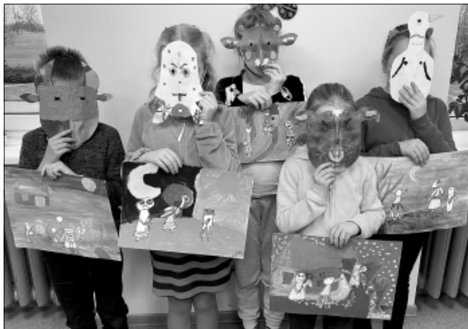
Gribam iet ķekatās! Bērpils pamatskolas 1. – 3.klašu audzēkņi Mārtiņdienas tradīcijām pievērsās gan vizuālās mākslas, gan latviešu valodas stundās, izgatavojot ķekatu maskas, kā arī izziņot šo svētku tradīcijas un ticējumus.