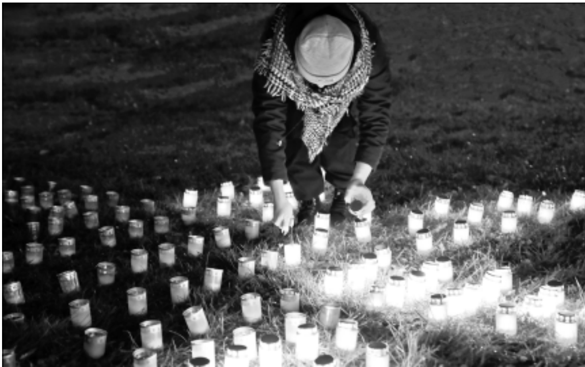
18.novembra svinības Viļakā. Jau par tradīciju Viļakā Latvijas dzimšanas dienā kļuvusi latvju zīmju veidošana no svecītēm.