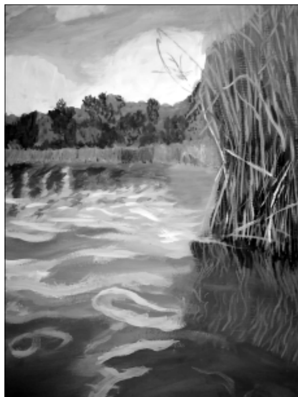
Rudens. Iritai patīk gleznot dabu, pamanīt tajā gadalaiku pārmaiņas.