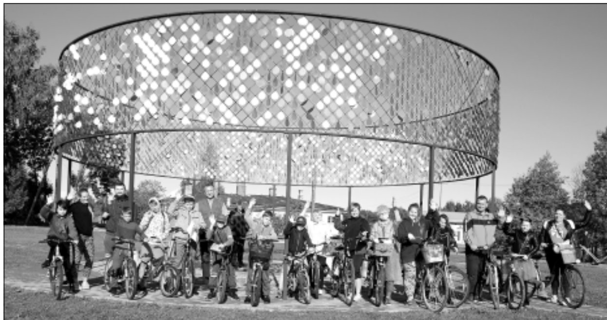
Velosipēdisti Viļākā. Iesūtīja Jānis S. no Viļakas.

Katra mēneša labākās fotogrāfijas autors saņems balvu. Fotogrāfijas var iesūtīt pa pastu - Balvi, Teātra ielā 8, LV-4501, vai elektroniski - vaduguns@apollo.lv. Pie foto obligāti norādāms vārds, uzvārds (vēlams - tālrunis).