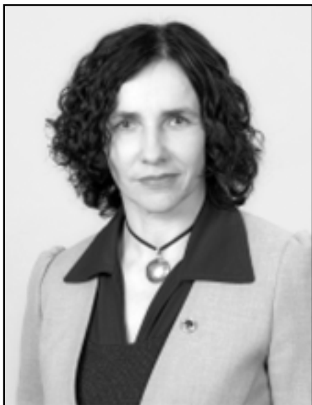
ILGA ŠUPLINSKA , 13.Saeimas (neatkarīgā) deputāte

Lai nebūtu pārpratumu un lieku manipulāciju, esmu vakcinējusies un par vakcināciju, taču par brīvprātīgu vakcināciju, īpaši vecumposmā līdz 50 gadiem. Kāpēc? Neap-