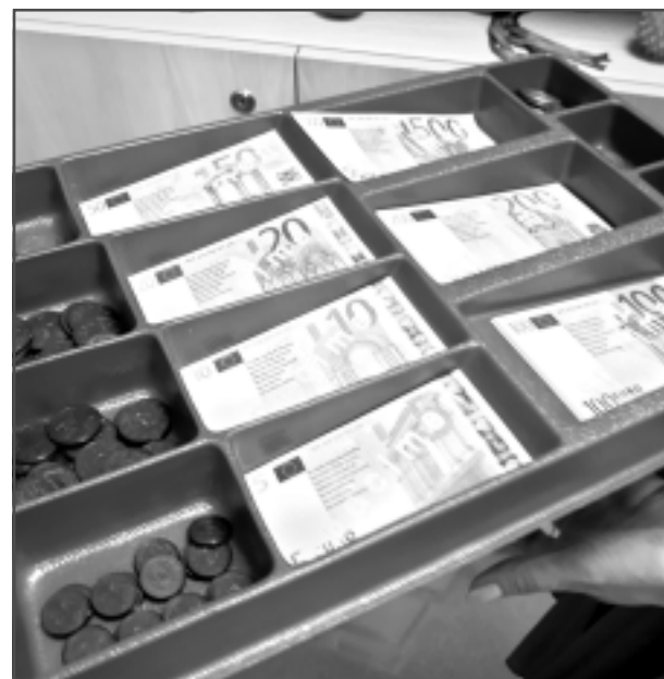
Skaita arī naudu. Centra darbiniekiem jābūt ļoti pacietīgiem, lai dienu no dienas sadarbotos ar klientiem un iemācītu viņiem sadzīviskas prasmes, kaut vai pazīt un skaitīt naudu. Pieaugušie klienti dodas arī uz veikalu un iepērkas, pielietojot apgūtās prasmes.