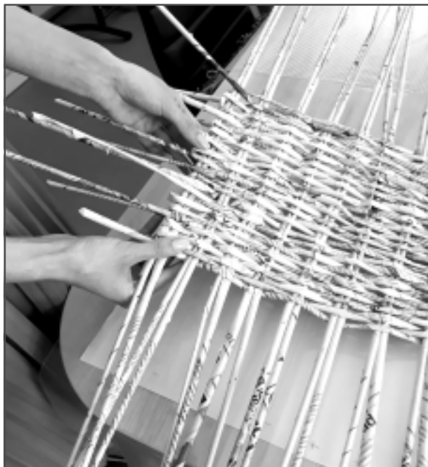
Var arī no avīzēm. Sākumā grūti iedomāties, ka no avīzēm, prasmīgi tās sarullējot stienīšos, var nopīt groziņu. Galvenais ir likt darboties rokām, attīstot sīko motoriku. Tās ir plaukstu un pirkstu kustības, kurās iesaistīti mazie roku muskuļi.