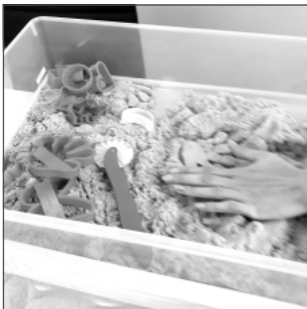
Kinētiskās smiltis. Ļoti patīkama sajūta, paņemot smiltis rokās. No tām var gatavot formiņu nospiedumus, rullēt, kaut ko izveidot. Jauka nodarbība sanāk arī uz smilšu galda, veidojot krāsainus zīmējumus atbilstoši noskaņojumam.