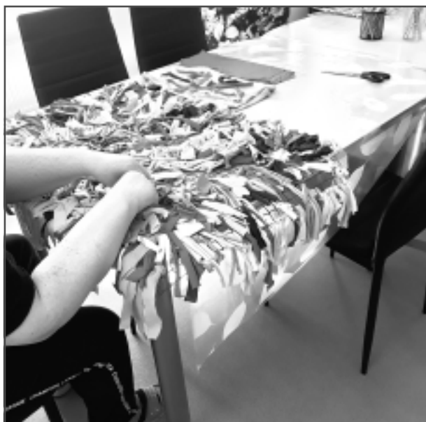
Pieaugušo nodarbība. Top lupatu sedziņa. Darbs prasa uzmanību un pacietību. Nodarbības paredzēts izmantot ļoti dažādus dabiskas izcelsmes materiālus, arī aitas vilnu, lai rokas izjustu atšķirību.