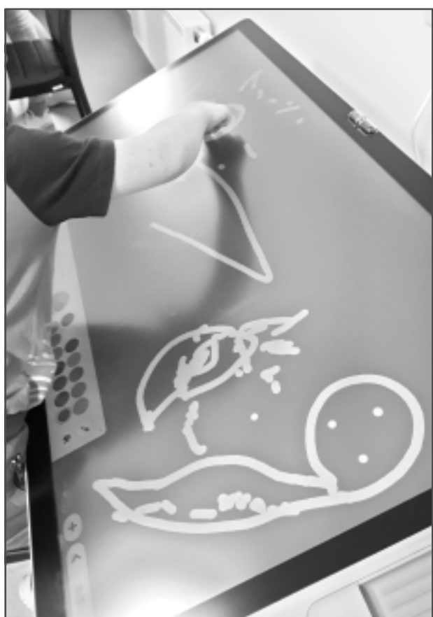
Multītāfele. To var izmantot gan bērni, gan pieaugušie. Vieniem patīk zīmēt, citi sameklē arī lietišķa rakstura informāciju.

Dienas aprūpes centrā notiek dažādas nodarbības ar mērķi piesaistīt klientu uzmanību, likt darboties rokām, līdz top kāds konkrēts darbiņš, par ko priecāties pašiem un var parādīt arī citiem. Tādēļ te ir dažādas iekārtas: adāmašīna, šujmašīna, sveču liešanas aparāts, bet bērniem ļoti daudzveidīgu spēļu klāsts, ieskaitot interaktīvo multītāfeli, kinētiskās smiltis, krāsaino smilšu galdu.