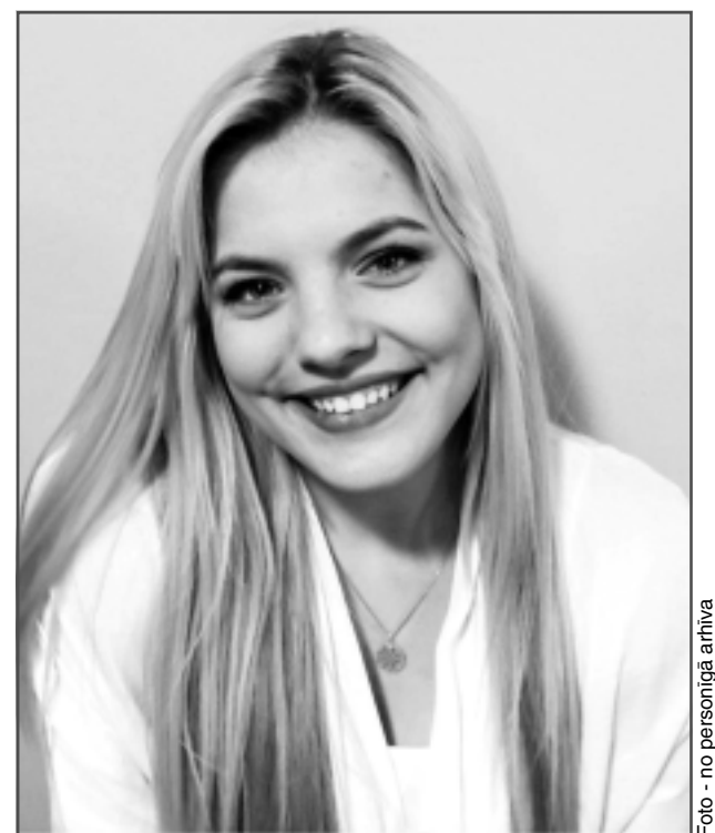
Aizkulisēs, gaidot savu uznācienu. Pirms katra koncerta ir uztraukums un prieks par iespēju dejot un priecēt gan sevi, gan citus.

Jauniešas uzskata, ka tas, kas vieno visus sportistus, ir dzinulis pēc mērķa un gribasspēks sasniegt mērķi. Viņa pati atzīst, ka ir