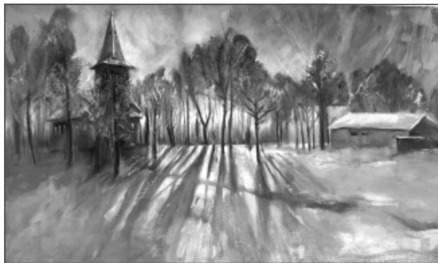
Olga Reče, "Rīts Balvos".