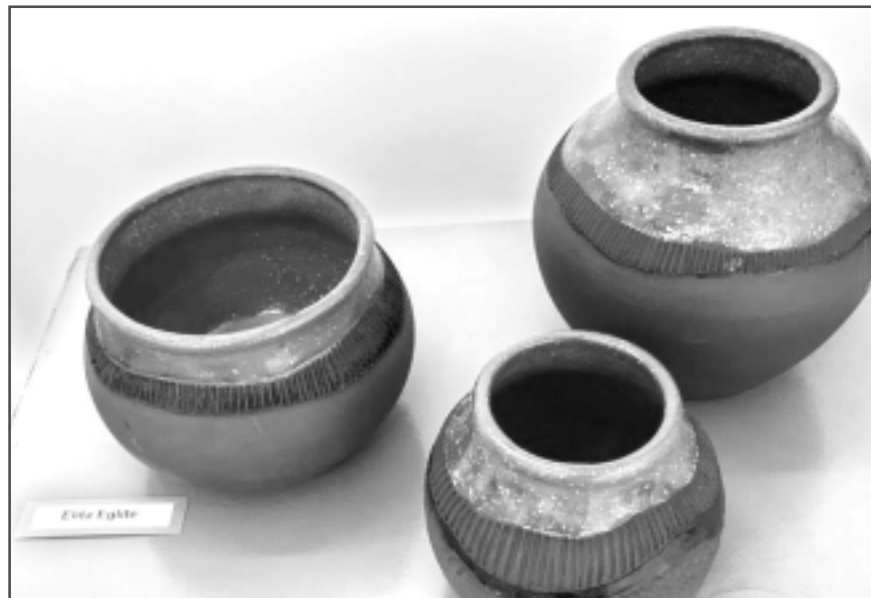
Elīta Eglīte, "Keramika".