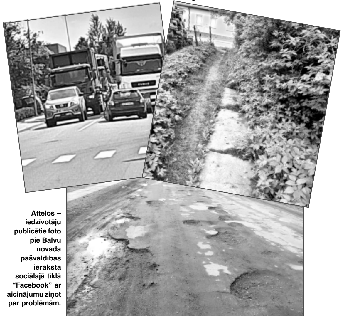
Attēlos – iedzīvotāju publicētie foto pie Balvu novada pašvaldības ieraksta sociālajā tīklā “Facebook” ar aicinājumu ziņot par problēmām.

Jāpiebilst, lai ātrāk un ērtāk atrisinātu dažādus saimnieciska rakstura jautājumus gan Balvos, gan Balvu novadā, pašvaldība aicina iedzīvotājus ziņot par dažāda rakstura problēmām. Piemēram, bojājumiem ielu apgaismojumā vai infrastruktūrā, nesankcionētām izgāztuvēm, ielām, ceļiem un citiem tamlīdzīgiem jautājumiem. Saņemtā informācija (vēlams ar problēmas aprakstam pievienotu fotogrāfiju) tiks nodota atbildīgajiem pašvaldības darbiniekiem. Jāteic, iedzīvotāji šo iespēju diezgan naski arī izmanto, ziņojot par visdažādākajām problēmām. Par daļu no tiem rakstījām arī laikraksts “Vaduguns”. Piemēram, kāda iedzīvotāja atkārtoti aktualizēja jautājumu par Daugavpils un Bērzpils ielu krustojumu pie SIA “Rezonans”. “Regulāri tiek apdraudēti tie autovadītāji, kuri brauc pa šo ielu Rugāju virzienā un atpakaļ, jo iekrašanās darbi notiek uz braucamās daļas un traucē redzamību. Man šodien ļoti paveicās. Tiku cauri sveikā, nesasitot mašīnu, kad man preti izbrauca busiņš ,” raksta iedzīvotāja. Tikmēr kāds cits iedzīvotājs aktualizēja sliktu tehniskā stāvoklī esošo ceļu gar Balvu Profesionālo un vispārīzglītojošo vidusskolu, arī celiņu uz Daugavpils ielu no Bērzpils ielas pie mājas 46, kur zāle nav pļauta, koki nav cirsti, celiņš ir knapi pamanāms, kanalizācijas vāku pie bērnu dārza “Pīlādītis”, kas kustas, un vēl, un vēl, un vēl... Balvu novada pašvaldība uz šiem jautājumiem atbild, un jācer, ka iedzīvotājiem aktuālas un pašvaldības kompetencē esošas problēmas tiks arī atrisinātas!