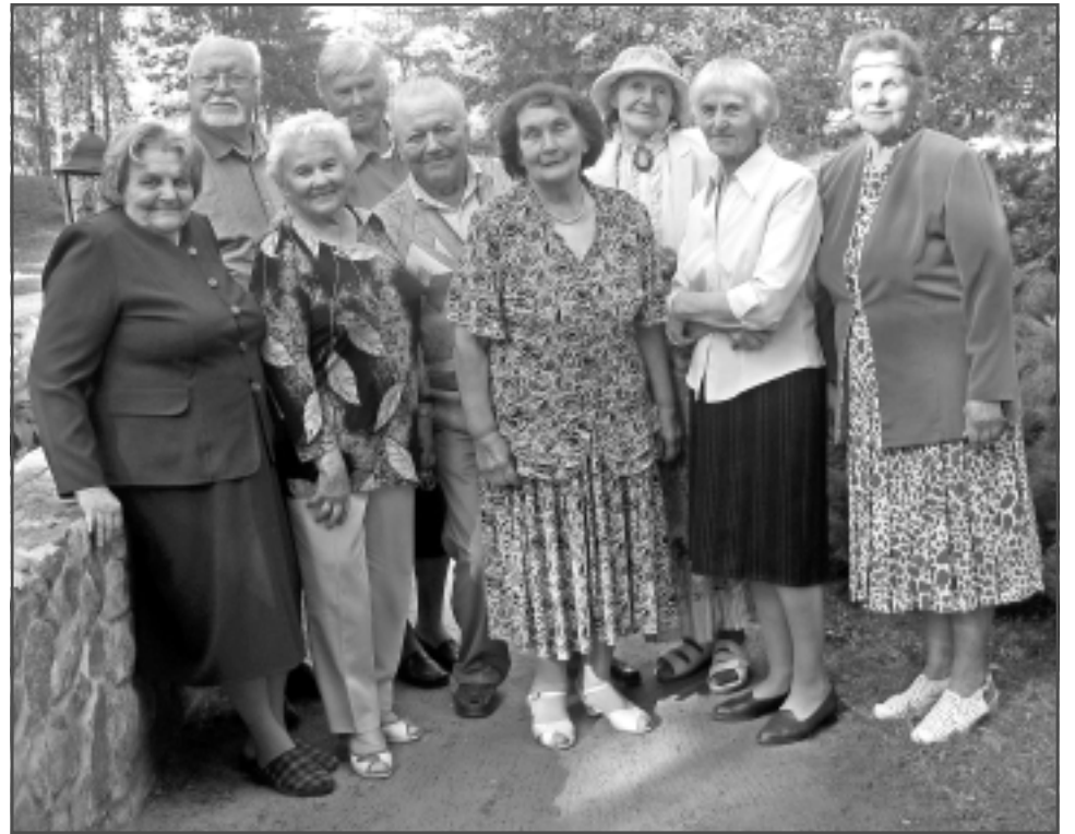
Rekovā ar Rēzeknes Pedagoģiskās skolas 1955.gada izlaiduma kursabiedriem.