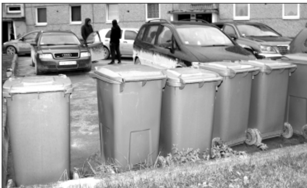
Sadzīves atkritumu apsaimniekošana. Konteineram noteiktajās atkritumu izvešanas dienās ir jābūt izstumtam specializētajam transportlīdzeklim pieejamā vietā. Jāatceras šie datumi un arī tas, ka atkritumu izvešana notiek arī svētku dienās un brīvdienās, kā arī sarkanajos kalendāra datumos. Ja ir nepieciešama papildus atkritumu izvešanas reize, to iespējams pieteikt telefoniski un rakstiski, savlaikus informējot klientu apkalpošanas speciālistus.

Līdz ar dabas resursu nodokļa likmes palielinājumu, arī pārējos mūspuses novados par atkritumu apsaimniekošanas pakalpojumu iedzīvotājiem būs jāmaksā aptuveni par 5% vairāk. SIA "ZAAO" sabiedrisko attiecību speciāliste Z.Leimane informē, ka visos trijos novados - Baltinavas, Rugāju un Viļakas - maksājums par 240 litru konteineru izvešanu, ieskaitot PVN, šogad ir 5,84 eiro, par 1100 litru konteineru ar PVN ir 26,78 eiro. Maksa par kubikmetru bez PVN - 20,12 eiro.