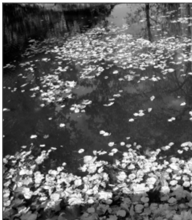
Lāča dārzs, diķis. Iesūtīja Rūdolfs Kozlovs no Balviem.

Katra mēneša labākās fotogrāfijas autors saņems balvu. Fotogrāfijas var iesūtīt pa pastu – Balvi, Teātra ielā 8, LV-4501, vai elektroniski – vaduguns@apollo.lv. Pie foto obligāti norādāms vārds, uzvārds (vēlams - tālrunis).