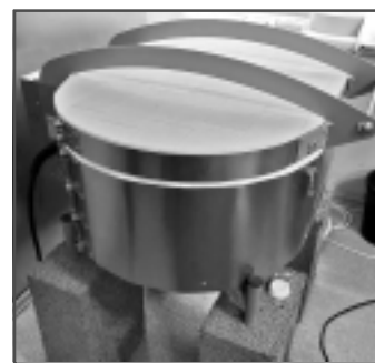
Stikla kausējamā krāns. Tajā var pārkausēt lietotas pudeles, burkas, logu stiklu un tad darināt interjera priekšmetus vai praktiski izmantojamus traukus, piemēram, šķīvjus saldumiem vai dažādām uzkodām.