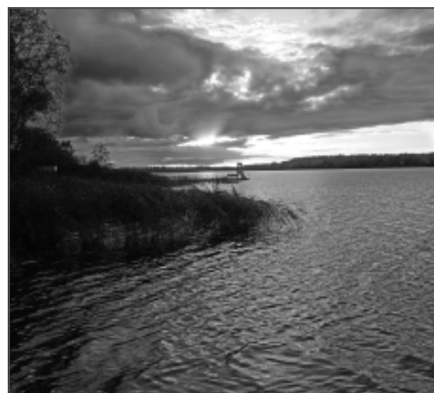
Balvu ezers.