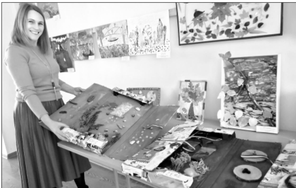
Zeme. Ūdens. Gaiss. 1.vietu jaunākajā vecuma grupā šogad piešķīra Tilžas PII grupiņas “Ežuki” neparastajam kopdarbam, kas žūriju pārsteidza ar oriģinalitāti. Uz katras no trim kartona pamatnēm, izmantojot dabas materiālus, bērni atainojuši kādu no trim stihijām – zemi, ūdeni un gaisu.