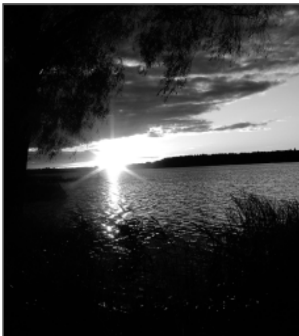
Saule atvadās.

Katra mēneša labākās fotogrāfijas autors saņems balvu. Fotogrāfijas var iesūtīt pa pastu – Balvi, Teātra ielā 8, LV-4501, vai elektroniski – vaduguns@apollo.lv. Pie foto obligāti norādāms vārds, uzvārds (vēlams - tālrunis).