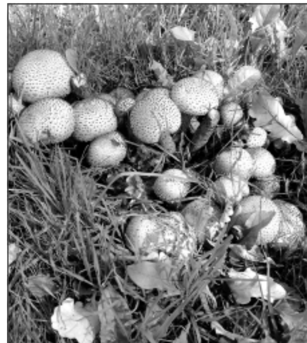
Sēņu ģimene Lāča dārzā.

Par novembra labākās fotogrāfijas autoru atzīts ILVARS VIZULIS ar fotogrāfiju "Ceļā uz saulrietu", kas publicēta 17.novembrī. Pēc balvas griezties redakcijā.