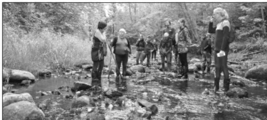
Kā tikt pāri upei? Izrādījās, ka bebru aizsprosti izmainījuši ūdens līmeni Liepnas upē, un tas izrādījās augstāks nekā organizatori sākumā domājuši. Taču tā nebija problēma, un visi tika pāri upei. Vai sausām kājām, tas lai paliek noslēpums.