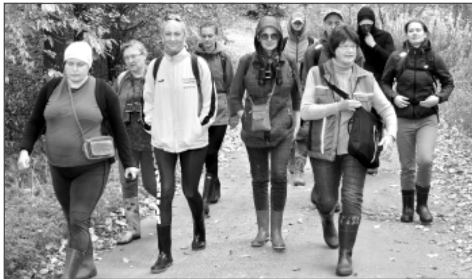
Interesanti stāsti. Pārgājiena dalībnieki klausījās gides stāstus par cilvēkiem, kas šeit reiz dzīvojuši un strādājuši, cīnījušies par brīvību.