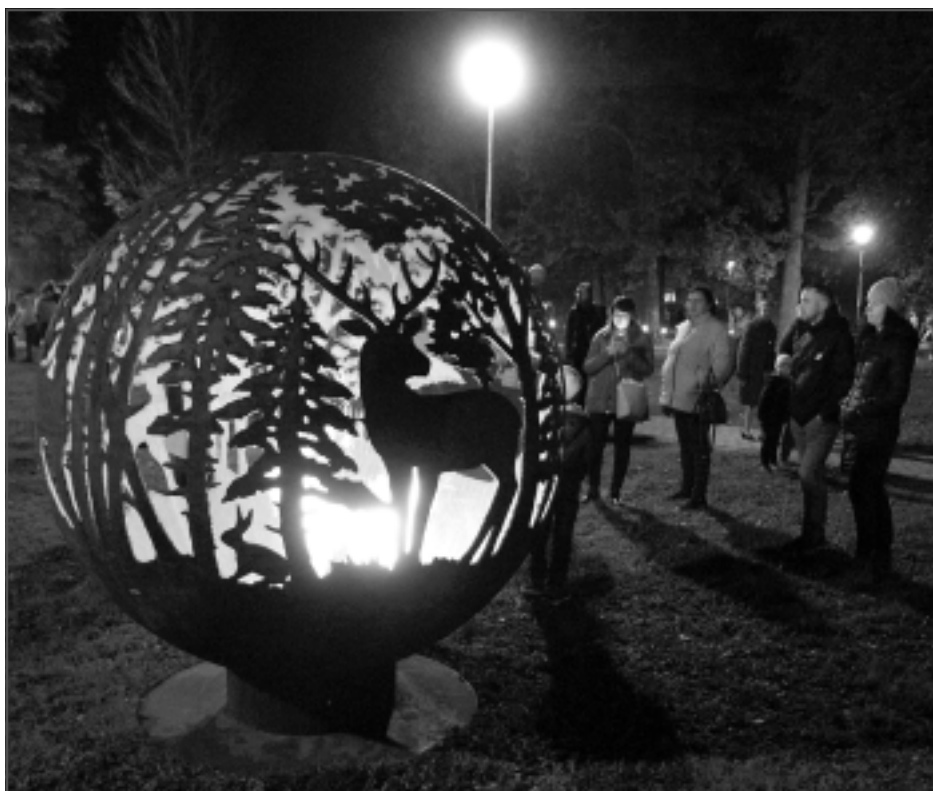
Burvīgi uguns kupoli. Pasākuma apmeklētājus iepriecināja ne tikai lāpas ceļā uz Lāča dārza saliņu, kas tagad ir izgaismota, bet arī fascinējošas uguns bumbas.