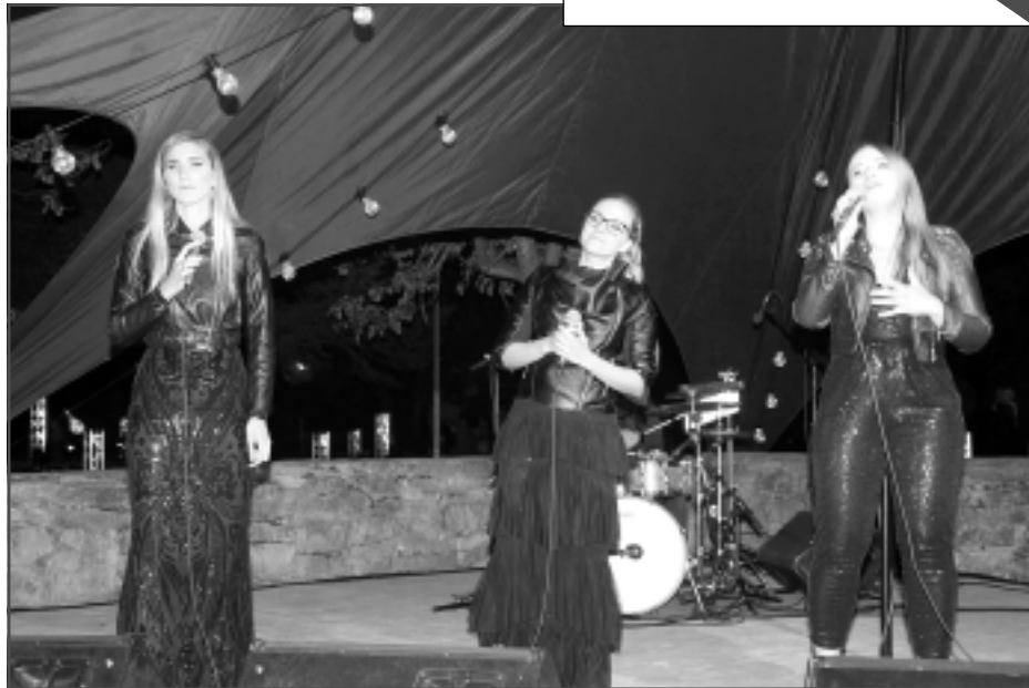
Priecē ar dziesmām. Grupas "Radio Trio" meitenes koncertu iesāka ar dziesmu "Viņi dejoja vienu vasaru".