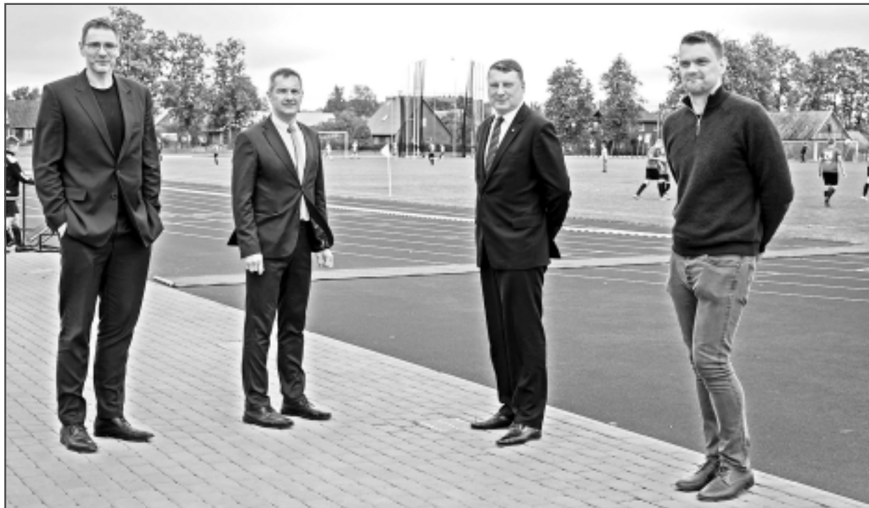
Apskata pilsētas stadionu. Ciemiņi atzinīgi novērtēja nesenu renovēto Balvu pilsētas stadionu, kas atbilst nepieciešamajiem standartiem, lai rīkoti valsts mēroga sacensības. Viņi paslavēja arī renovētos skolu stadionus un sporta zāles.

Divas reizes gadā – 4.maijā un 11.novembrī - valsts augstākā amatpersona piedalās militārajās parādēs. Budams bruņoto