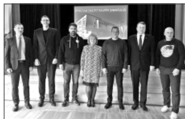
Tikšanās dalībnieki. LBS amatpersonas tikās arī ar vietējiem sporta jomas pārstāvjiem, lai pārrunātu basketbola attīstības iespējas nākotnē.

valsti vairāk attīstīts vīriešu basketbols. "Lepojamies, ka no desmit vispopulārākajiem sportistiem valstī četri ir basketbolisti," apgalvoja runātājs. Viņš atgādināja, ka arī Latvijas basketbola sievietes izlase guvusi ne mazums panākumu, kā arī ir piedalījusies Olimpiskajās spēlēs un pasaules čempionātā. "Desmit gadu laikā LBS īstenojusi vairākus projektus, panākot atzīstamus rezultātus," lepojās K.Cipruss.