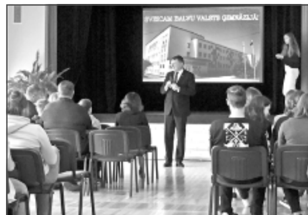
Atklāj prezidentu noslēpumus. A.Vējonis labprāt dalījās personīgajā pieredzē, ko guvis savas prezidentūras laikā, atklājot arī dažus mazus, plašākai sabiedrībai maz zināmus faktus.