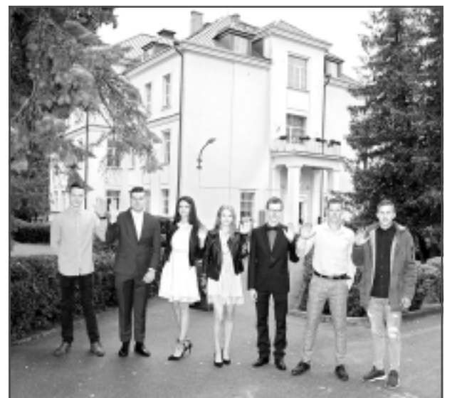
Vienīgā klase vidusskolā. Divpadsmitās klases audzēkņi atzina, ka neapskauž 9.klases skolēnus, jo viņi nevarēs turpināt mācīties Bērzpils vidusskolā. Taujāti, ko paši darītu šādā situācijā, jaunieši sprieda, ka visticamāk izvēlētos Rugāju vidusskolu: "Tiesa, tagadējie devītie vairāk raugās uz Rēzeknes pusi."