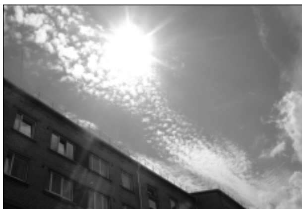
Jūnija svelmainā saule.

Katra mēneša labākās fotogrāfijas autors saņems balvu. Fotogrāfijas var iesūtīt pa pastu – Balvi, Teātra ielā 8, LV-4501, vai elektroniski – vaduguns@apollo.lv. Pie foto obligāti norādāms vārds, uzvārds (vēlams - tālrunis).