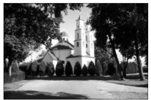
Vasaras svētkos Balvos. Iesūtīja Rūdolfs Kozlovs.