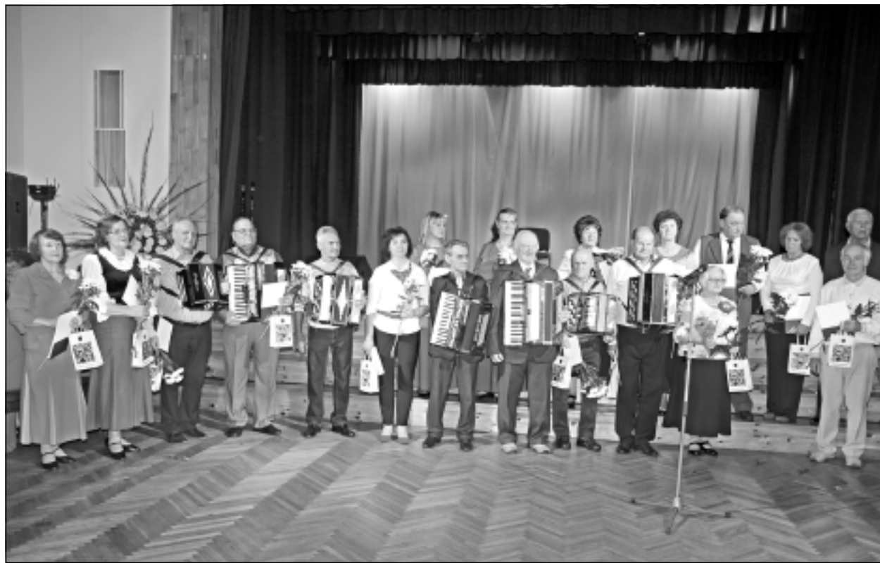
Sumina pašdarbniekus. Muzikanti un visu kolektīvu vadītāji saņēma Balvu novada Izglītības, kultūras un sporta pārvaldes Pateicības rakstus.