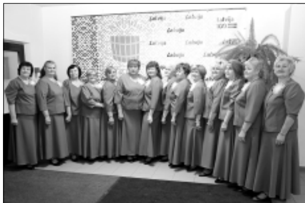
Pirms koncerta. Kubulu pagasta kultūras nama senioru deju kopas “Rūtas” pašdarbnieces steidza nofotografēties, kā pašas smēja, - lai paliek vēsturei.