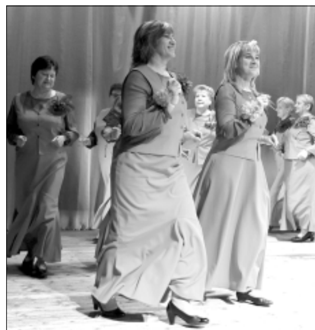
Pirmie deļotāji. Žiguru dāmu deju kopa “Alianse” skatītāju aplausus izpelnījās par gracioziem deju soļiem.