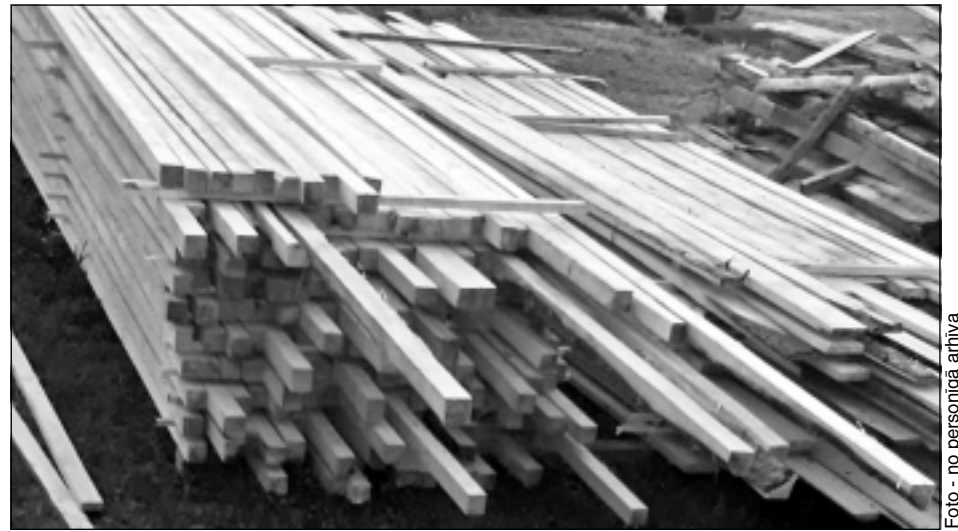
Sagādātais materiāls. Cilvēki no Briežuciema atveda jumta loksnes, "Gaujas koks" sagādāja kokmateriālu, daudz materiāla sagādāts arī no pašu meža, kur vējš nopostīja pāris kokus. Tagad tikai atliek ķerties pie darba. Māju saimnieki cer līdz ziemei ēkas dabūt zem jumta.