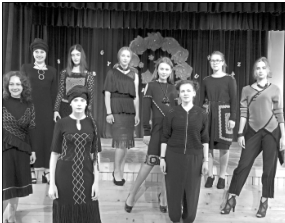
Modeles ir gandarītas. Melni zaļās kolekcijas modeles lepnī nesa un izrādīja savus tērpus modes skate apmeklētājiem, kuru vidū bija arī ārzemnieki.