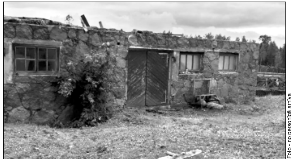
Būs jauna kūts. Sapratuši, ka ziema nav aiz kalniem, "Mežmalu" saimnieki nolēmuši savām 15 govīm uzcelt pagaidu kūti. Savukārt veco mūra ēku atjaunos vēlāk.