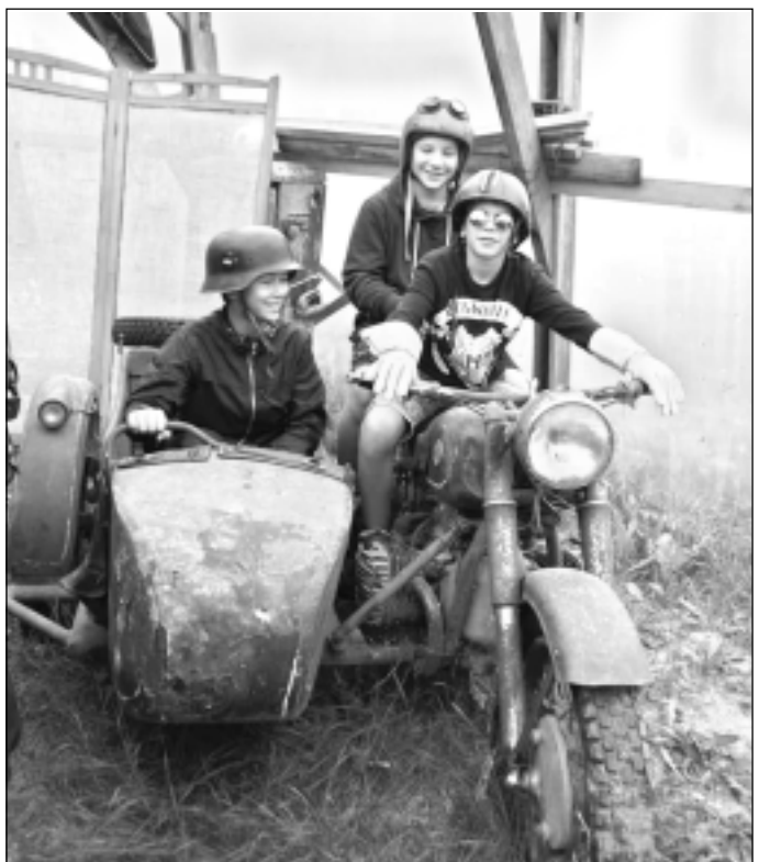
Zēni un tehnika ir nešķirami. Ar sevišķu aizrautību vecos braucamrīkus, ciemojoties retro moto klubā "Rūsa vēja", pētīja puīši.

mā atmosfērā, kuģojot ar plotu "Vilnītis" pa Balvu ezeru.