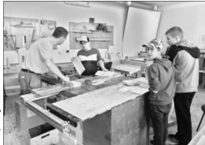
Pirmās iemaņas galdniecībā. Puīši nometnes laikā ar interesei iemēģināja roku kokapstrādē, skolotāja vadībā meistarojot putnu būrišus un vēja ķērājus.