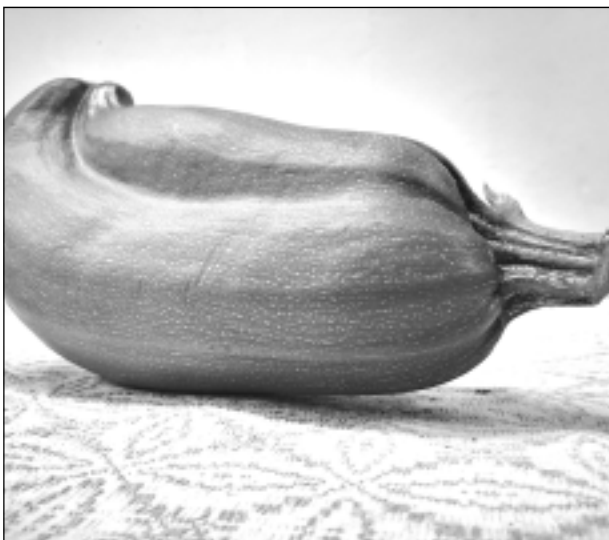
Divainais kabacis.