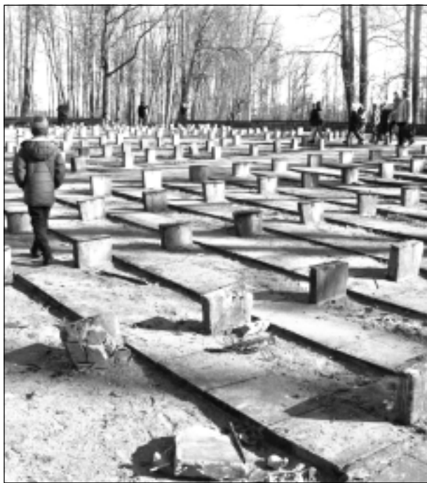
Balvu estrāde. Iesūtīja Pēteris no Balviem.

Katra mēneša labākās fotogrāfijas autors saņems balvu. Fotogrāfijas var iesūtīt pa pastu – Balvi, Teātra ielā 8, LV-4501, vai elektroniski – vaduguns@apollo.lv. Pie foto obligāti norādāms vārds, uzvārds (vēlams - tālrunis).