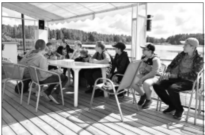
Patīkama atpūta. Vēl viens sen gaidīts piedzīvojums nometnes dalībniekiem bija brauciens pa Balvu ezeru ar plotu "Vilnītis".