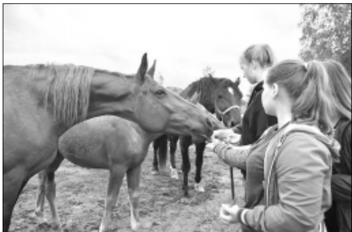
Zirgi patik visiem. Apmeklējot zirgu sētu "Kapulejas", bērni cienāja zirgus ar līdzpaņemtajiem gardumiem, bet drosmīgākie kāpa sedļos, lai dotos izjādē. Savukārt citi labprātāk izmantoja iespēju pavizināties zirga pajūgā.

Piedalīšanās daudzveidīgās saliedēšanās un radošajās aktivitātēs turpinājās arī nedēļas nogalē. Viens no sirsnīgākajiem uzdevumiem bija nosūtīt īpašus vēlējumus profesiju pārstāvjiem, kuri nometnes laikā dalījās savā dzīves pieredzē ar jauniešiem. To paveikuši, nometnes dalībnieki pabeidza dienu patīka-