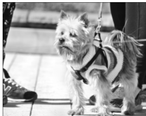
Lieldienās Balvos. Iesūtīja Pēteris no Balviem.