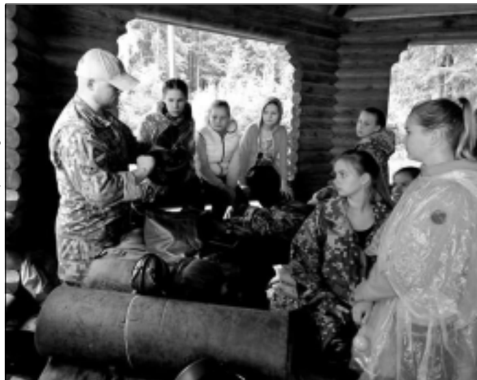
Vecajā parkā. Pēc pārgājiena kopā ar zemessargiem, nometnes dalībnieki daudz vairāk zina par militāro jomu. Iespējams tieši šeit kāds no viņiem nolēma nākotnē kļūt par karavīru, zemessargu vai, piemēram, robežsargu.