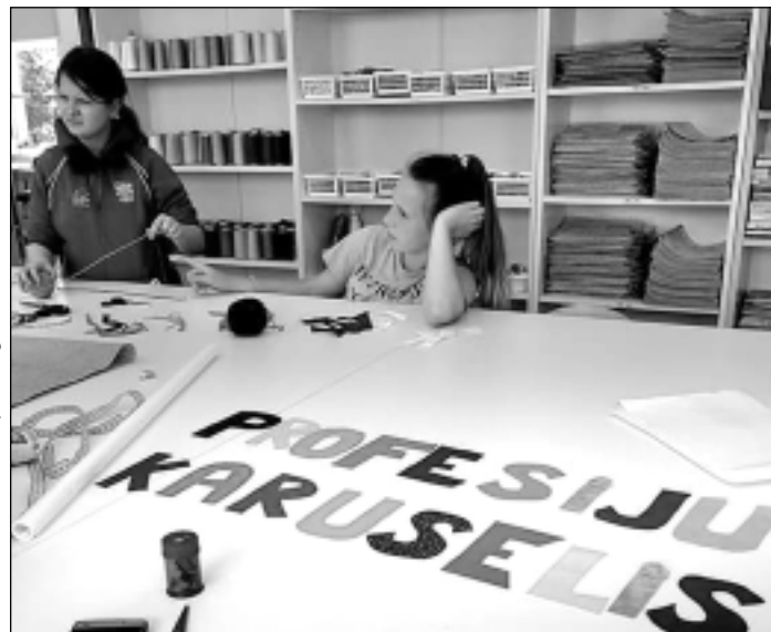
Meitenēm – meiteņu nodarbe. Kamēr puīši bija aizņemti kokapstrādes darbnīcā, meitenes izzināja šuvējas profesijas smalkumus. Viņu uzdevums bija sašūt cepurītes un grāmatzīmes, kā arī piedalīties nometnes karoga izgatavošanā.