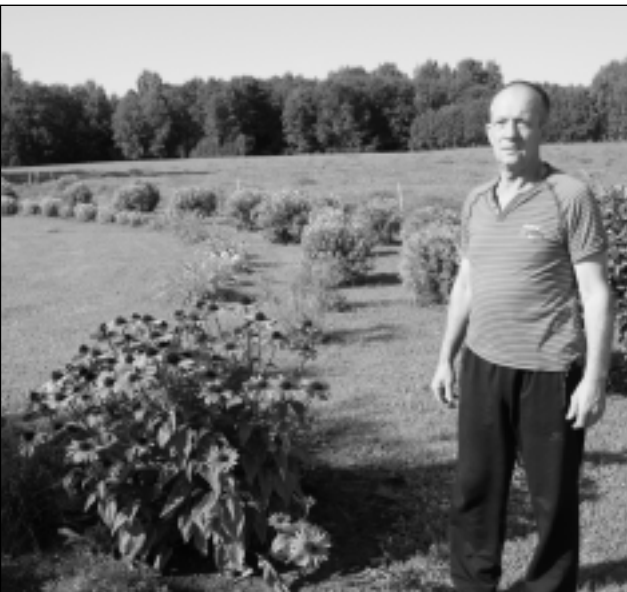
Jaunākā no puķu dobēm. Jaunākā no puķu dobēm lauku sētā “Ausmas” izveidota mājas iebraucamā un lielceļa malā. Par skaistumu te var papriecāties ikviens.