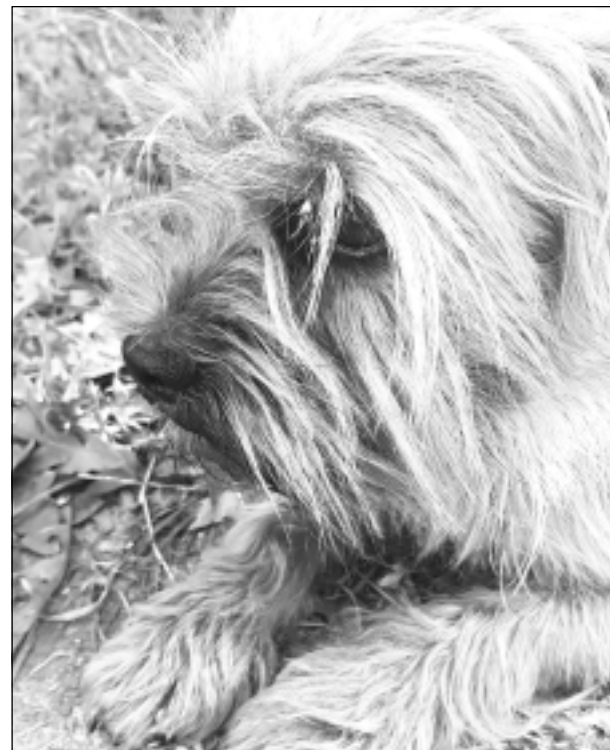
Drugs. Iesūtīja Dace Grāvīte.