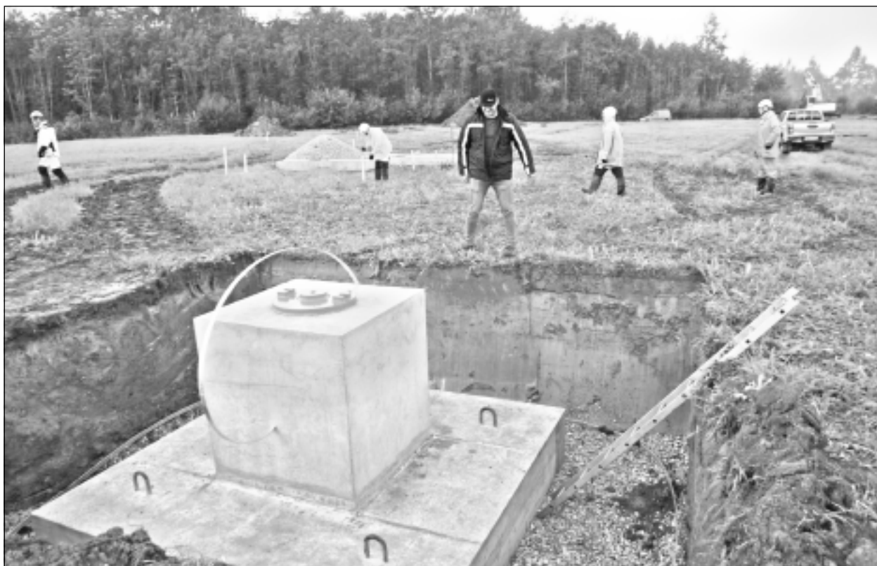
Izbūvē laukumu. Šonedēļ Aizpurvē, pļaviņā netālu no ceļa, notika rosīgi būvdarbi. Būvnieki ierīkoja vietu un izbūvēja pamatus jaunajam Latvijas televīzijas un radio apraides tornim pierobežā.