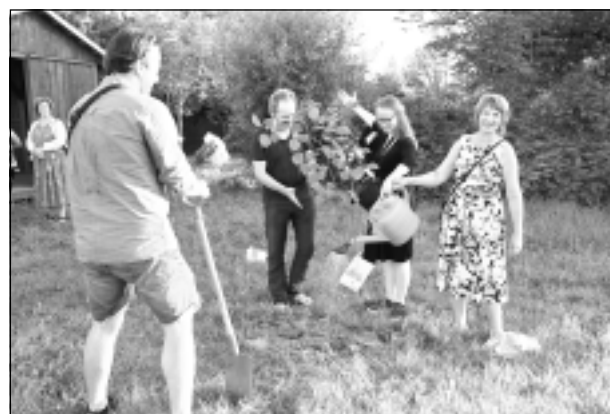
Iestāda liepu. Izrādes epilogā Tilžas centrā iestādīja liepu - lai tā šeit aug un piedzīvo Tilžas nākotni.