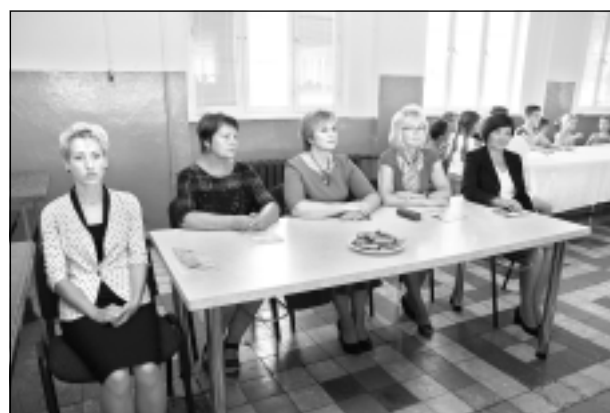
Sāpe. Tilžas internātpamatskolā izskanēja sāpe par skolas slēgšanu.