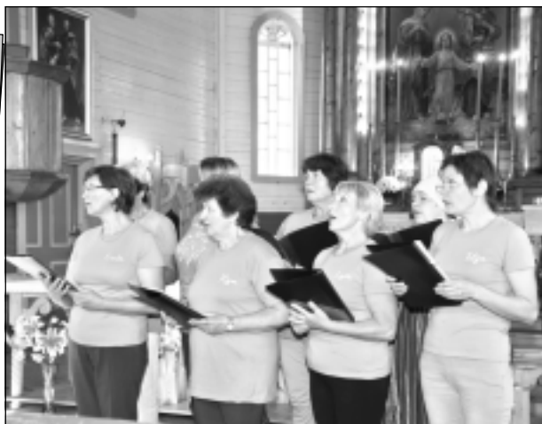
Baznicā. Izrāde "Breinuma līpa" sākās katoļu baznicā, kur vietējo ļaužu stāstījumu fragmentus izdziedāja Tilžas sievietes koris "Varavīksne" (foto).