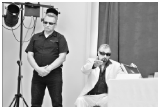
Kazino vai kaziņas? Ceturtais uzņēmējs piedāvāja no tilženiešiem atpirkt vienu no četrām baznīcām, kur ierīkos kazino, nevis turēs kazas. "Vašei dzerevņe četrē baznīcas par daudz," viņš skaidroja. Jautāts, ko par to Dieviņš sacīs, mafiozo lietīšķi atteica: "Prostit."