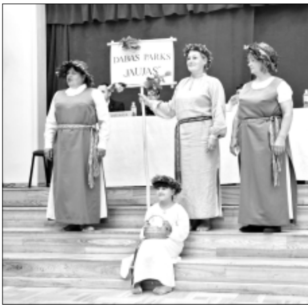
Piedāvā veidot parku. Konferencē "Tilžas nākotne" meža laumas (foto) lūdza finansējumu dabas parka "Jaujas" izveidei. Projekta atbalsta gadījumā viņas solīja radīt 11 jaunas darbavietas.